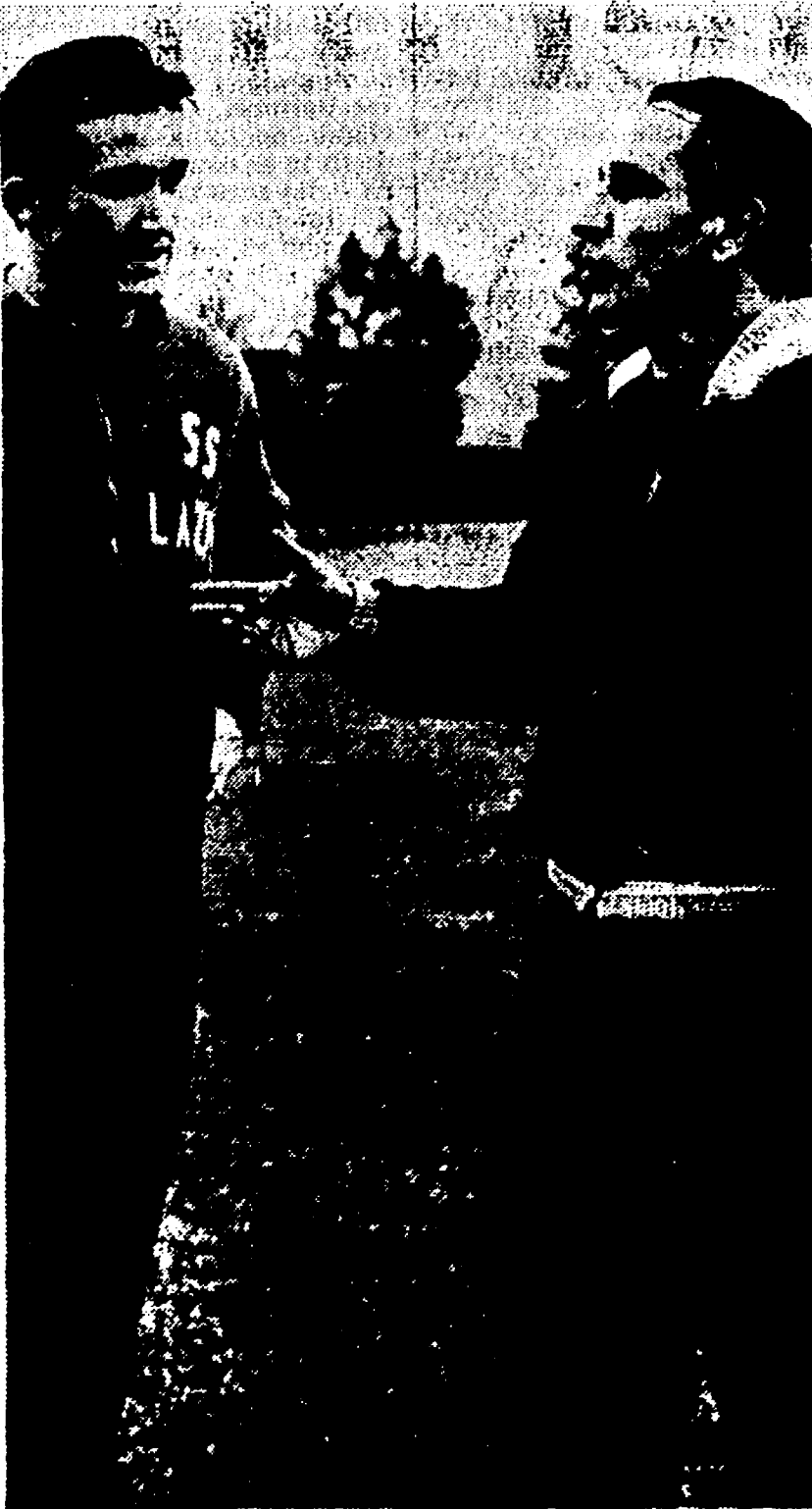
Il sovietico Jakob Ryls si è laureato questa sera campione mondiale di sciabola individuale battendo nella finale il polacco Jerzy Pawlowski per 5-0. L'azzurro Vladimir Calarese si è aggiudicato la medaglia di bronzo con la vittoria riportata sul magiaro Bakonyi.