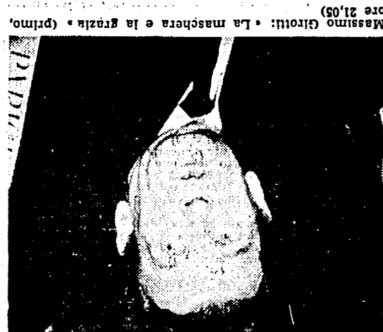
Massimo Girotti: «La maschera e la grazia» (primo, ore 21.05)

Un film del brivido (primo, ore 21.05) 23.05 Notte sport 22.05 Servizio speciale vacanze in automobile 21.15 Il Paroliere questo sconosciuto 21.05 Telegiornale