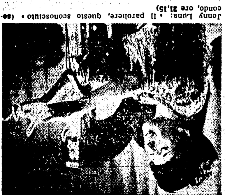
Gialli per l'estate (secondo, ore 15.15)

Un film del brivido (primo, ore 21.05) 23.05 Notte sport 22.05 Servizio speciale vacanze in automobile 21.15 Il Paroliere questo sconosciuto 21.05 Telegiornale