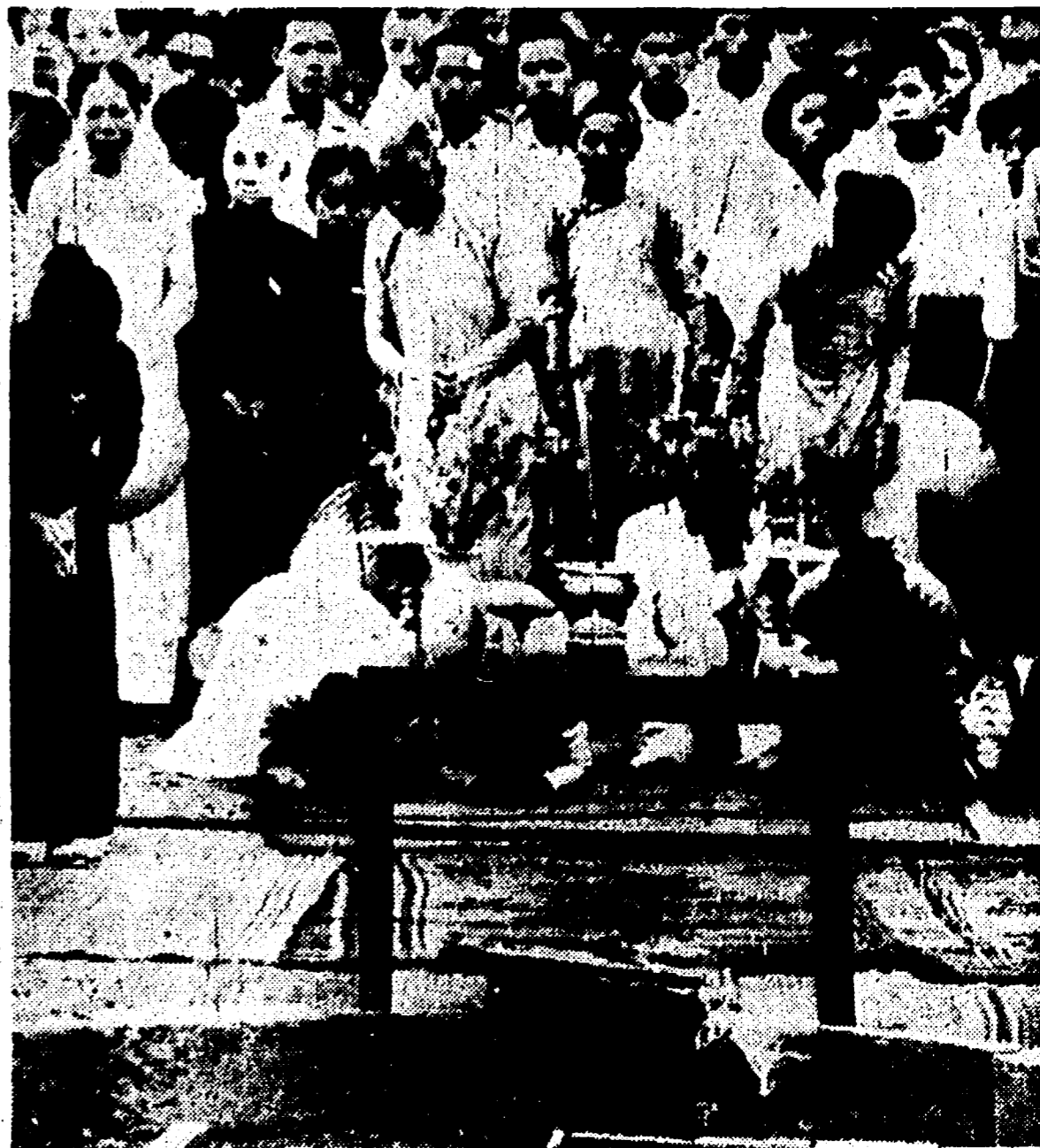
SAIGON — Donne buddiste pregano intorno al luogo dove si è suicidato il monaco