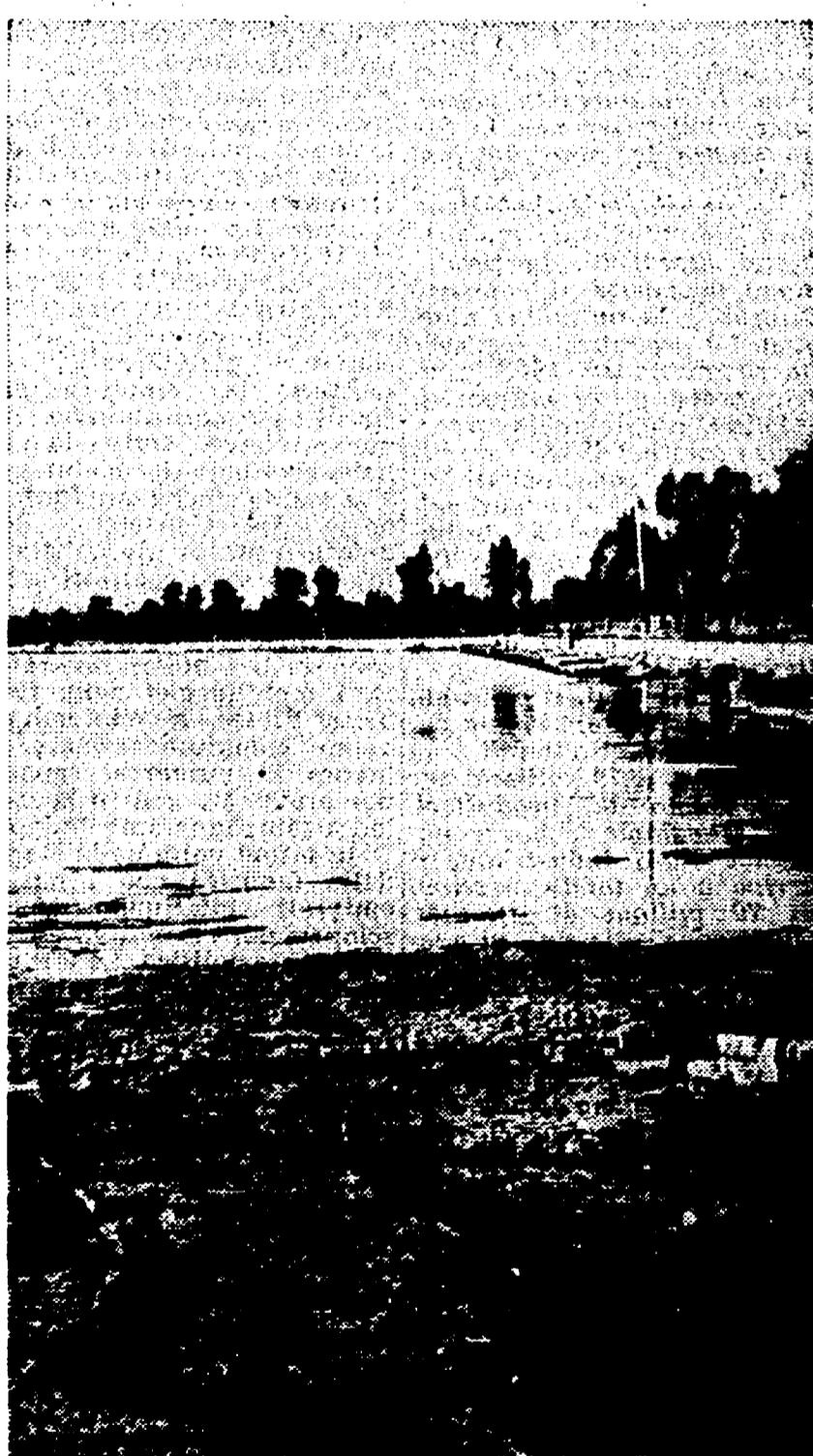
Uno scorcio del lago Patria ove si svolgeranno le gare di canottaggio: come è noto è stato necessario «bonificare» il lago dalle mine e costruire tutte le altre attrezzature necessarie.

Se non si cambia la denominazione tutti i concorrenti verranno squalificati dalla Federazione mondiale