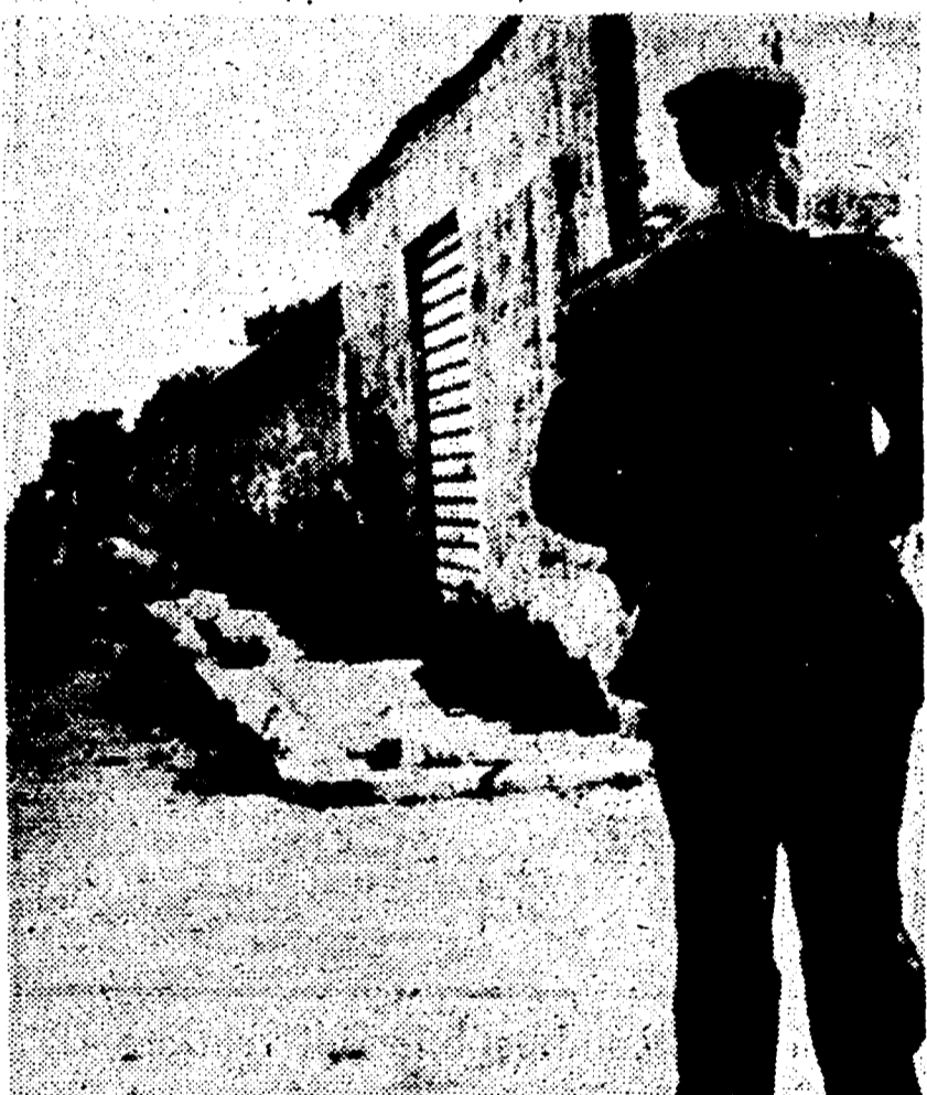
PALERMO — Una villa, in cui si sospetta siano nascosti alcuni ricercati, completamente circondata da poliziotti.