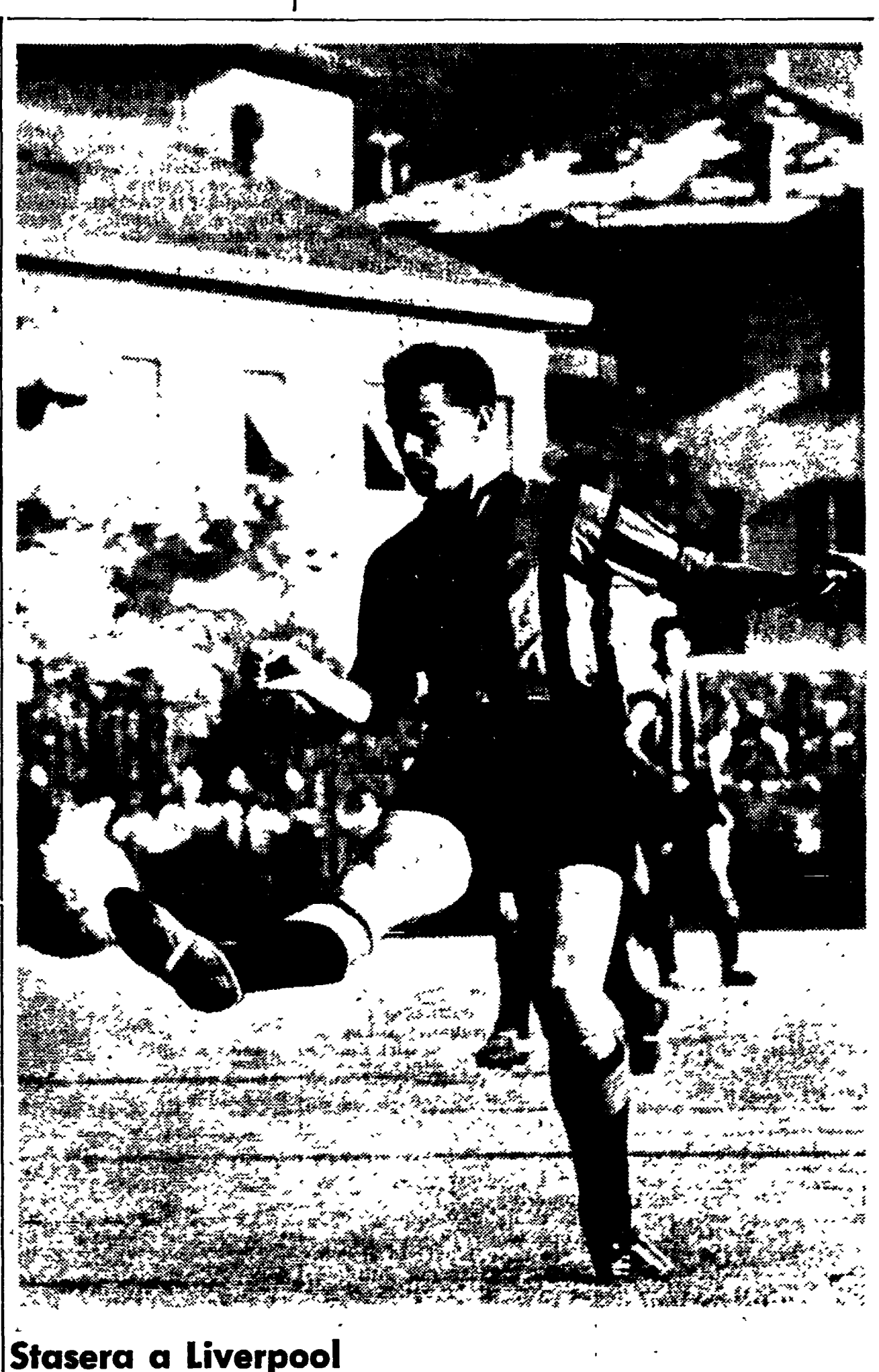
Stasera a Liverpool