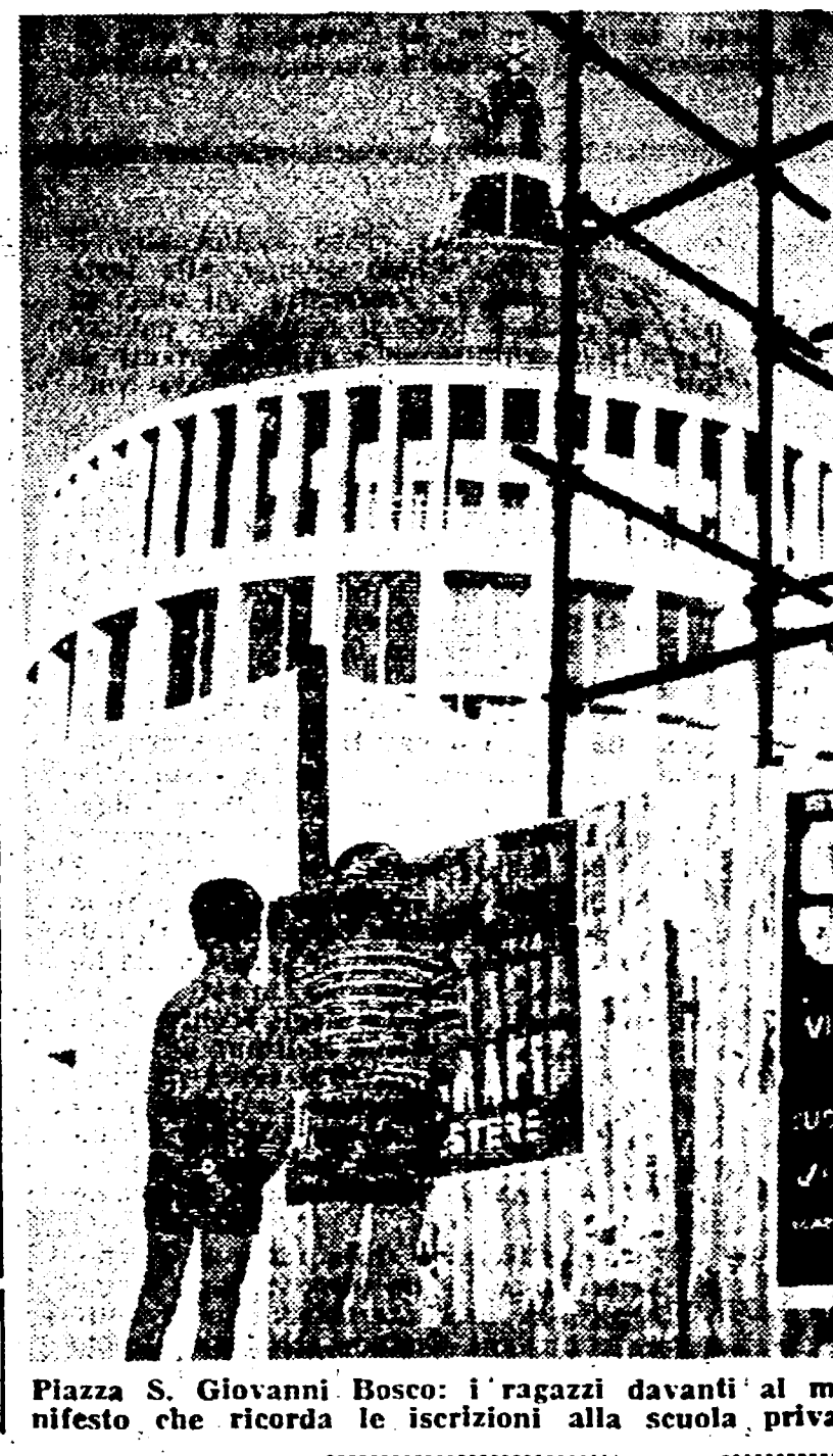
Piazza S. Giovanni Bosco: i ragazzi davanti al manifesto, che ricorda le iscrizioni alla scuola privata