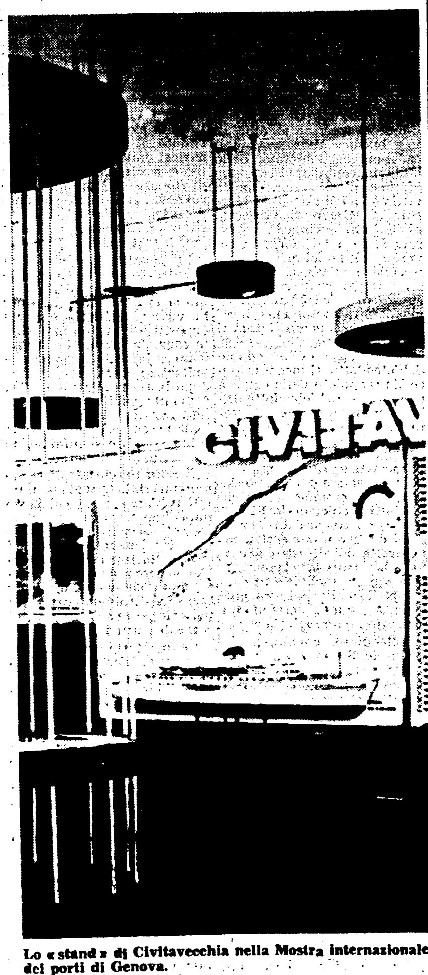
Lo «stand» di Civitavecchia nella Mostra internazionale dei porti di Genova.