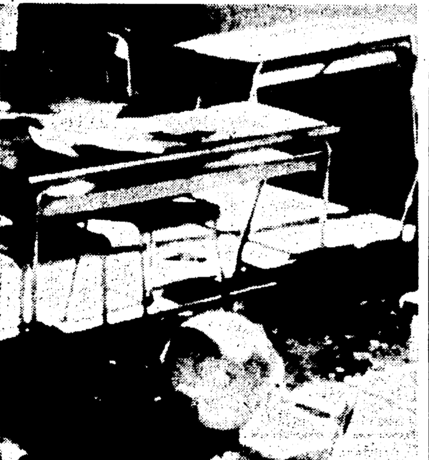
LONGARONE — Così è apparsa una delle aule della scuola dopo la tragedia.

Accettata la proposta della CGIL: anche gli emigrati avranno il sussidio - 50.000 lire ai pensionati