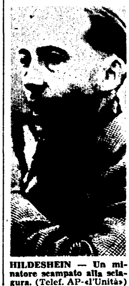
HILDESHEIM — Un minatore scampato alla selatura.