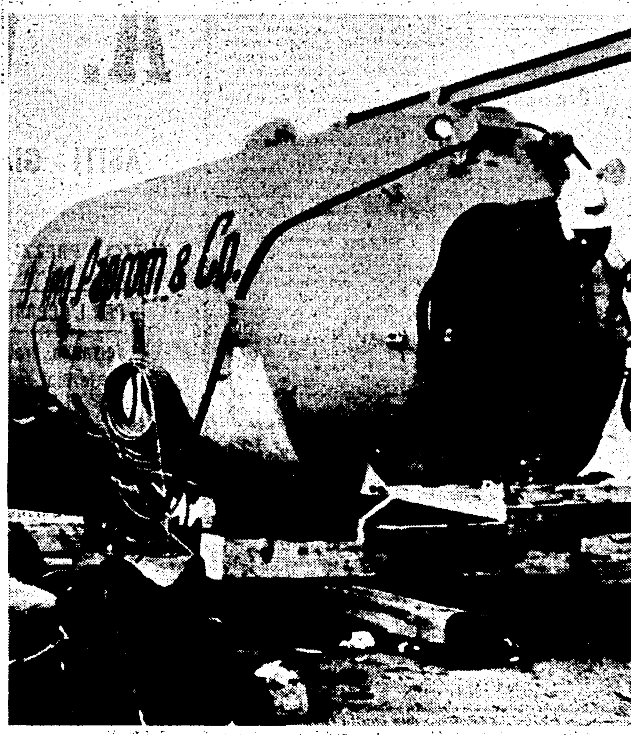
LENGEDE — Questa è la camera di decompressione nella quale verranno messi i tre minatori appena portati in superficie.