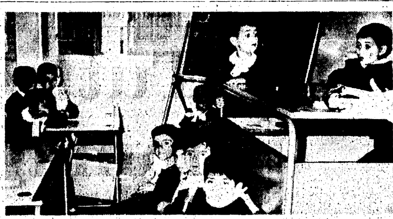
Cagliari, scuola di S. Perùzeddu: alcuni alunni non hanno il banco e siedono sulla pedana della cattedra

Sardegna: ancora caos nella scuola elementare e dell'obbligo