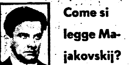
Come si legge Majakovskij?