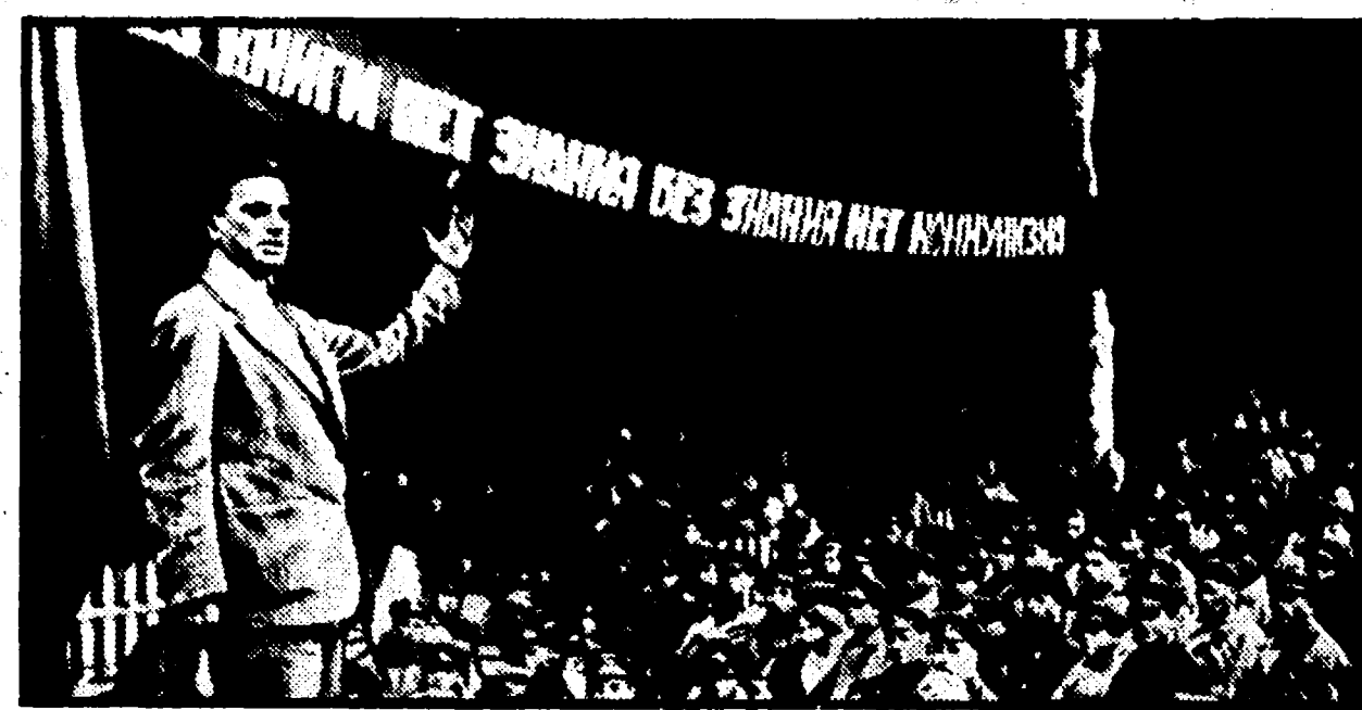
9 luglio 1929: Majakovskij parla a un reggimento di fanteria