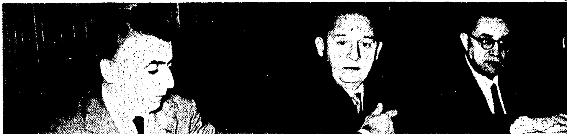
Lo Stato Maggiore della Federcalcio. Da sinistra: F. R. A. N. C. S. Q. U. A. L. E. e BARASSI

Colpevole assenteismo del CONI, della Federcalcio e della TV