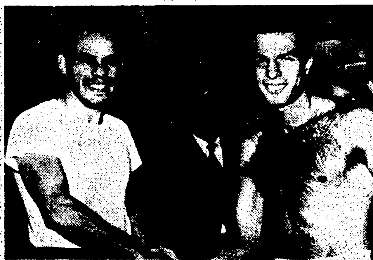
Oggi a Sidney in Australia Sandro Mazzinghi difenderà il titolo mondiale dei medi junior dall'assalto di Ralph Dupas (da Sandro detronizzato a Milano). Nella foto in alto i due avversari al peso nel primo incontro a Milano. (Nelle pagine interne il servizio di Signori)