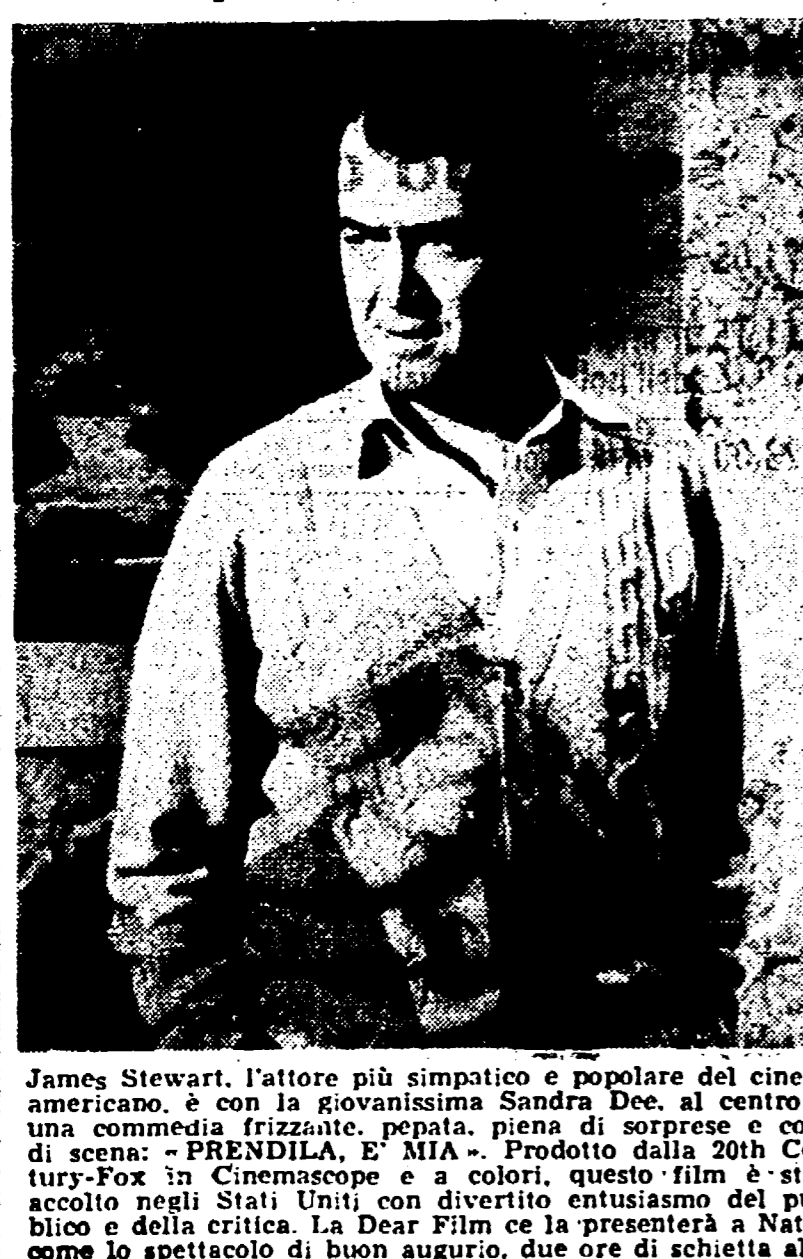
James Stewart, l'attore più simpatico e popolare del cinema americano...