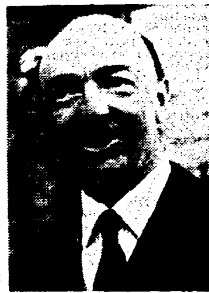
L'ex ministro Profumo

LE REVOLVERATE che il giamaicano Johnny Edgecombe scariò la notte del 14 dicembre 1962 contro la porta di Christine Keeler hanno avuto un bersaglio inimmaginabile: quando furono esplose, l'establishment, la « società costituita », cioè della Gran Bretagna. Nacque così, per caso, lo scandalo Profumo e ancora oggi, a un anno di distanza, non si può dire che sia chiuso. Nel breve giro di alcuni mesi la figura di un ministro — barone di Savoia, consigliere privato di Sua Maestà, generale dell'esercito, deputato per diciotto anni e membro del governo per nove — è stata can-