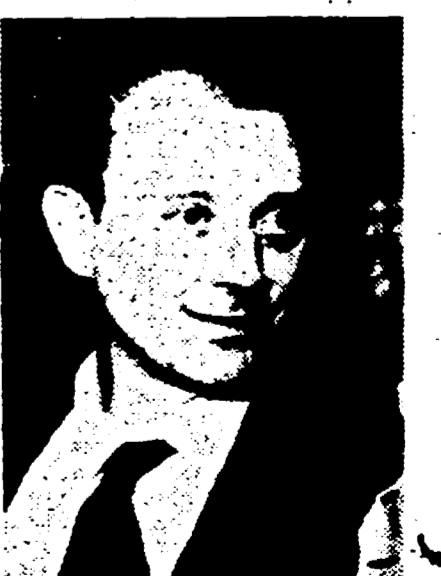
Il dottor Ward

millan ha dovuto abbandonare il suo posto e nessuno può negare che lo scandalo abbia influito, in qualche misura, sulla decisione. E' già molto, ma non è tutto. A queste prime conseguenze visibili altre ne vanno aggiunte, più profonde e più insidiose per la società inglese. Lo scandalo Profumo, al di là di un episodio di dolce vita, viene considerato e non a torto la riprova dell'usura di una classe dirigente. I rappresentanti dell'establishment sono ap-