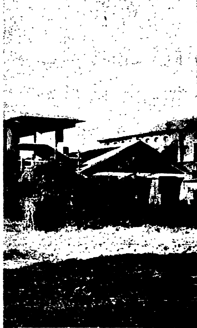
Una palazzina abusiva, con veduta su villa Celimontana, sta sorgendo su un terreno destinato, dal piano regolatore, a parco pubblico. La nuova violazione della legge a dispetto, ancora una volta, dei diritti dei cittadini, è stata denunciata da «Italia nostra» che ha inviato un telegramma di protesta alle autorità. L'edificio in cemento armato sorge su un'area che attualmente è di proprietà di una casa cinematografica ed è ben visibile dal Palatino, dall'Aventino e dal Circo Massimo. Intanto si è appreso che al Sostituto procuratore della Repubblica dottor Di Maio sono pervenute nel mese scorso circa sessanta denunce di cittadini che segnalano avvenute costruzioni e sopraelevazioni abusive di case. Nella foto: la palazzina in costruzione.