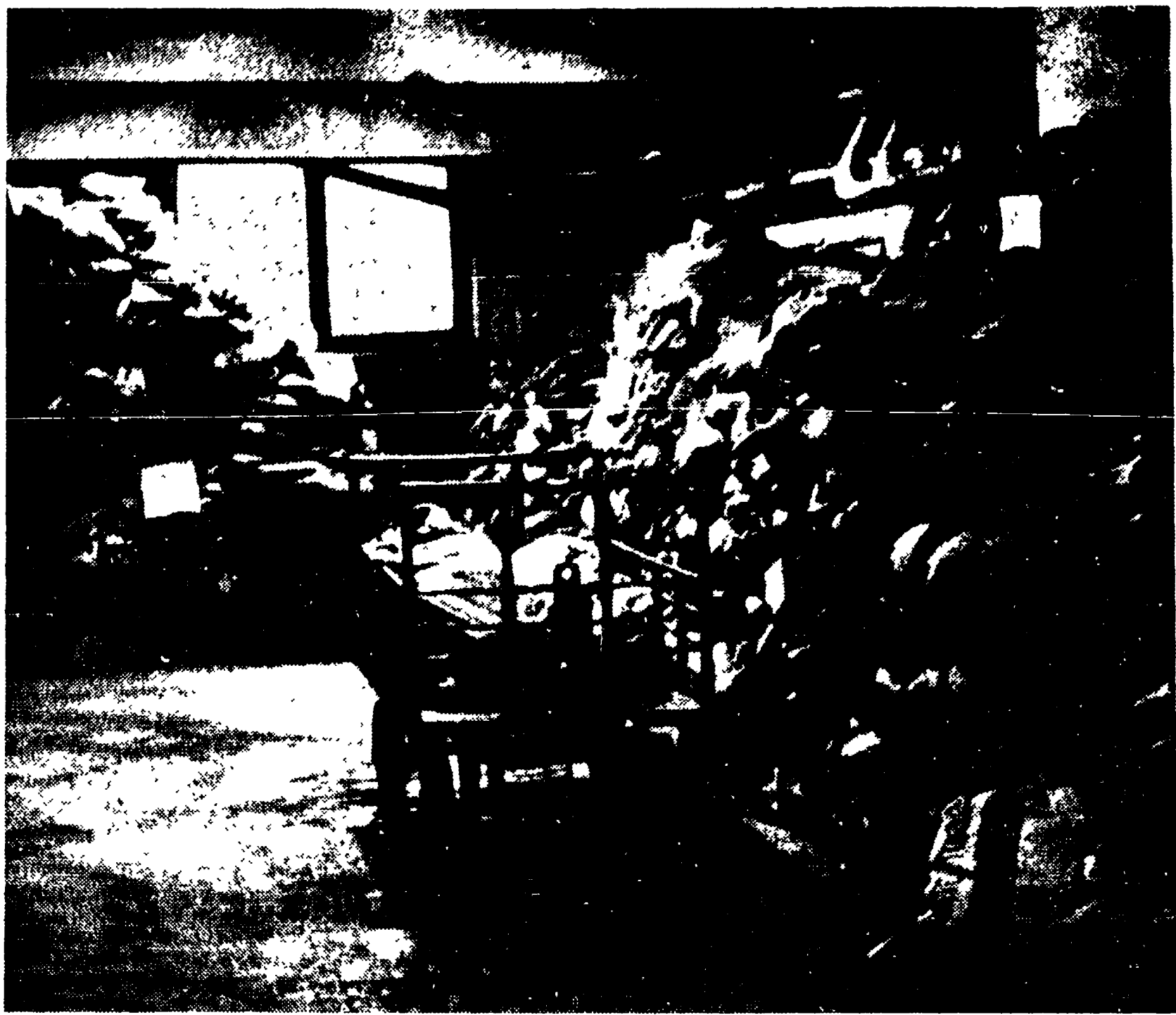
Il magazzino di Termini: migliaia di lettere non recapitate