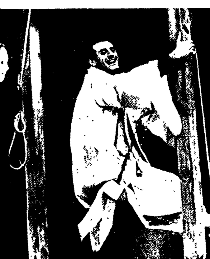
Dario Fo in una scena della sua ultima novità "Isabella, tre caravelle e un cavaliere" che tanto successo sta ottenendo al Teatro Valle.

Le sigle che appaiono accanto ai titoli del film corrispondono alle seguenti classificazione per generi: A - Avventuroso, B - Comico, C - Documentario, D - Drammatico, E - Giallo, F - Musical, G - Sentimentale, H - Satirico, I - Storico-mitologico. Le sigle che appaiono accanto ai titoli del film corrispondono alle seguenti classificazione per generi: A - Avventuroso, B - Comico, C - Documentario, D - Drammatico, E - Giallo, F - Musical, G - Sentimentale, H - Satirico, I - Storico-mitologico.