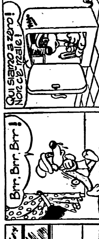
QUI SIAMO A ZERO! Non c'è zero!