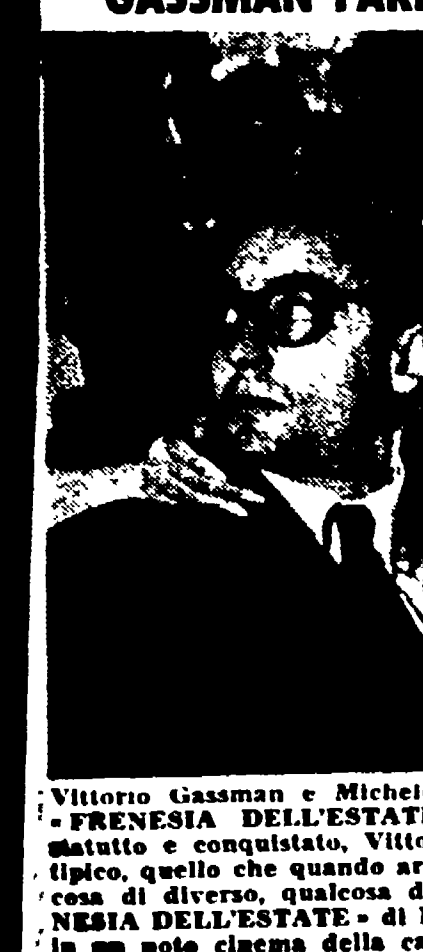
Vittorio Gassman e Michele Mercer in una scena del film «FRENESIA DELL'ESTATE». Spavaldo, sornione, conquistato e conquistato, Vittorio Gassman impersona l'italiano tipico, quello che quando arriva l'estate sogna di essere qualcosa di diverso, qualcosa di più giovane di nuovo. «FRENESIA DELL'ESTATE» di Luigi Zampa è in programmazione in un'anteprima della capitale.