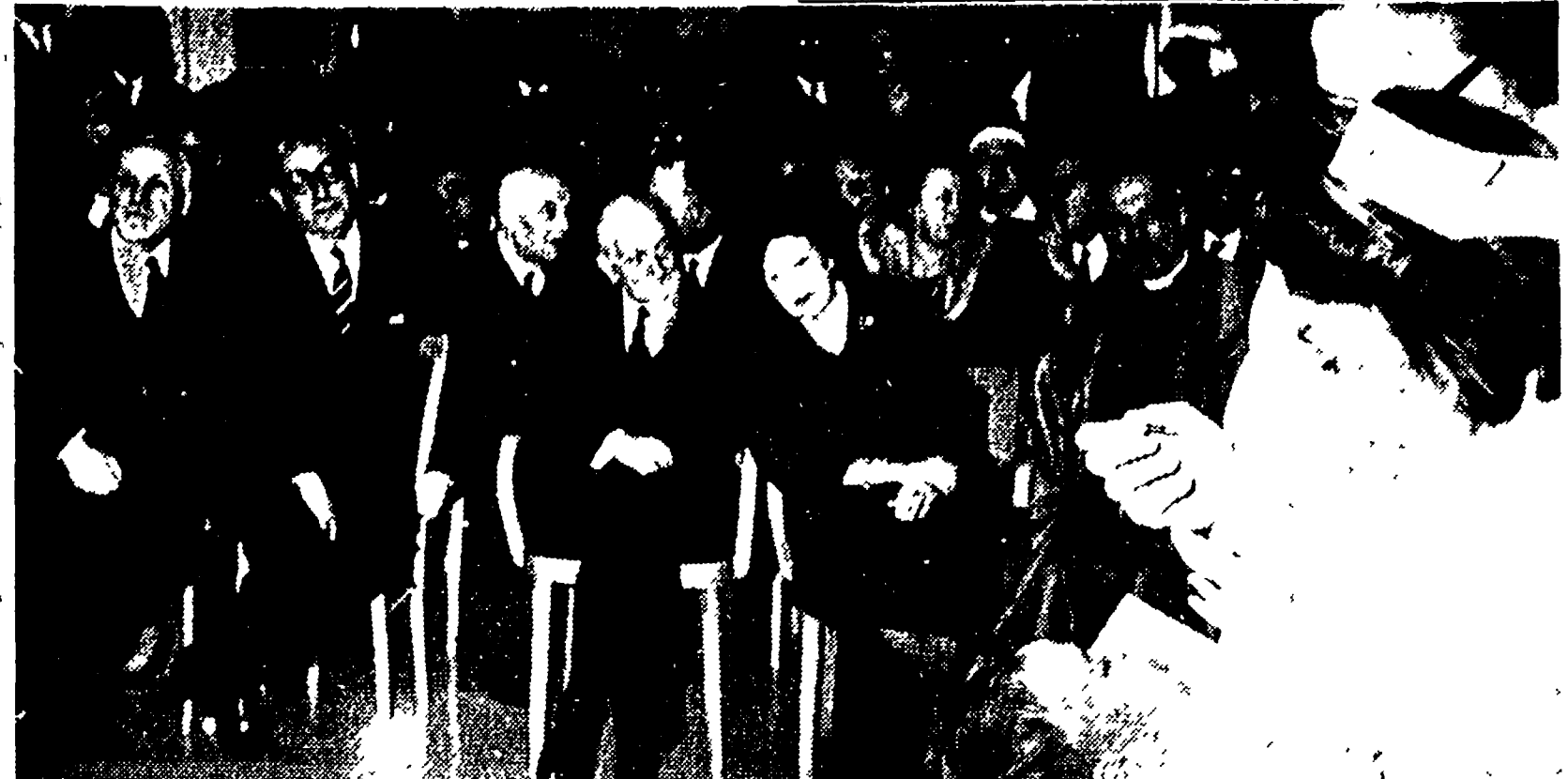
Un momento della cerimonia ufficiale che ha aperto la campagna antipolio ieri mattina in un asilo romano della ONMI...