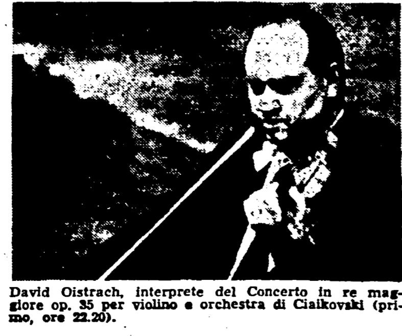
David Oistrach, interprete del Concerto in re maggiore op. 35 per violino e orchestra di Ciaikovski (primo, ore 22,50).

NAZIONALE Giornale radio: 7, 8, 13, 15, 17, 20, 23, 6:35. Corso di lingua francese; 8:25. Il nostro buongiorno; 10:30. La Radio per le Scuole; 11:12:20. Trasmissioni regionali; Passeggiate nel tempo; 11:15. Musica e divagazioni turistiche; 11:30. Musica sinfonica; 12. Gli amici della 12; 12:15. Arlecchino; 12:55. Chi vuol essere lieto...; 13:15. Carillon; 13:25. Nuove leve; 14. Trasmissioni regionali; 15:15. Renato Carosone e il suo complesso; 15:45. Quadrante economico; 16. Roicaleo; 16:30. Corriere del disco; 17:25. Ribalta d'oltreoceano; 18. Vi parla un medico; 17:10. « La Trovata »; 19:10. L'informatore degli artigiani; 19:20. La comunità umana; 19:30. Motivi in giostra; 19:33. Una canzone al giorno; 20:20. Appiarsi a...; 20:25. Il Convegno dei Cinque; 21:10. Concerto di musica operistica; 22:05. Gli scrittori del film; 22:15. Musica folkloristica greca; 22:30. L'Approdo. SECONDO Giornale radio: 8:30, 9:30, 10:30, 11:30, 13:30, 14:30, 15:30, 16:30, 17:30, 18:30, 19:30, 20:30, 21:30, 22:30, 7:35. Musiche del mattino; 8:35. Canta Enzo Jannace; 8:50. Uno strumen-