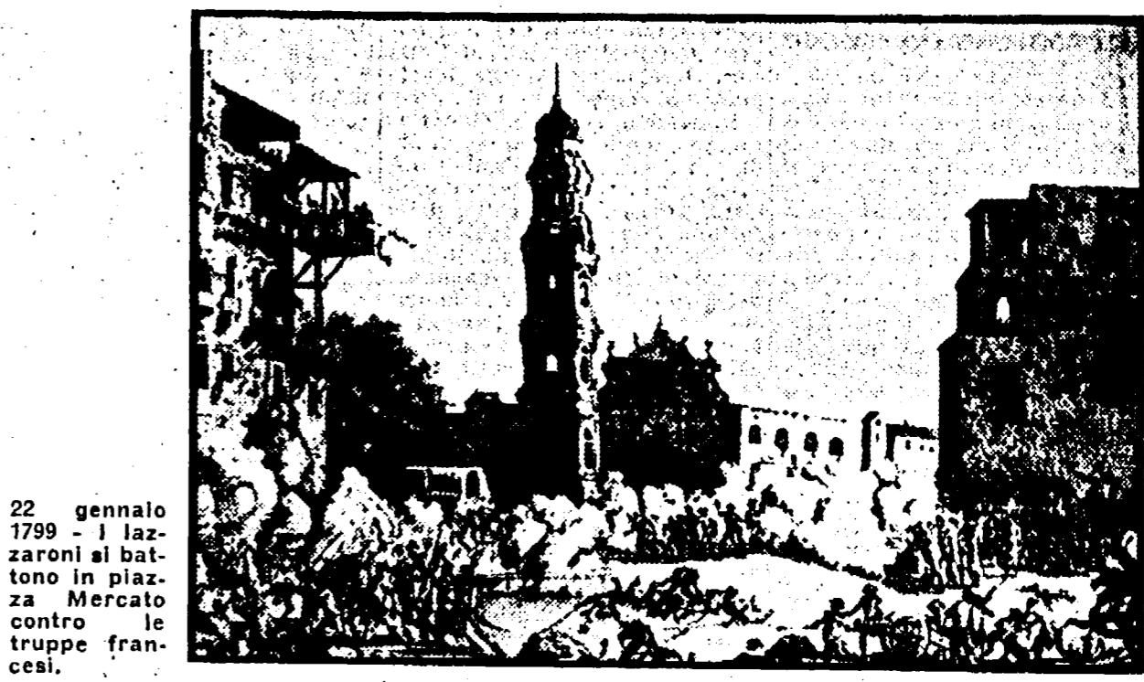
22 gennaio 1799 - I lazzeroni al battono in piazza Mercato contro le truppe francesi.

bolezza del governo repubblicano. Carlo De Nicola, in fondo, non aveva pianto al momento della fuga del re: incomincia a desiderarne il ritorno quando vede che l'ordine non può essere assicurato né dai francesi, né dai pochi giacobini napoletani, verso i quali, istintivamente e forse senza rendersi conto, aveva pure provato all'inizio un moto di interesse, quasi di simpatia.