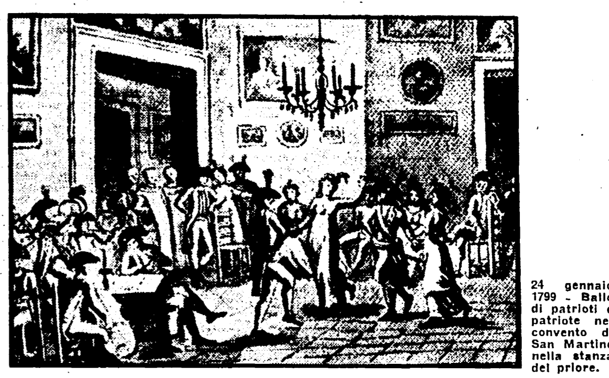
24 gennaio 1799 - Ballo di patrioti e patriote nel convento di San Martino nella stanza del priore.