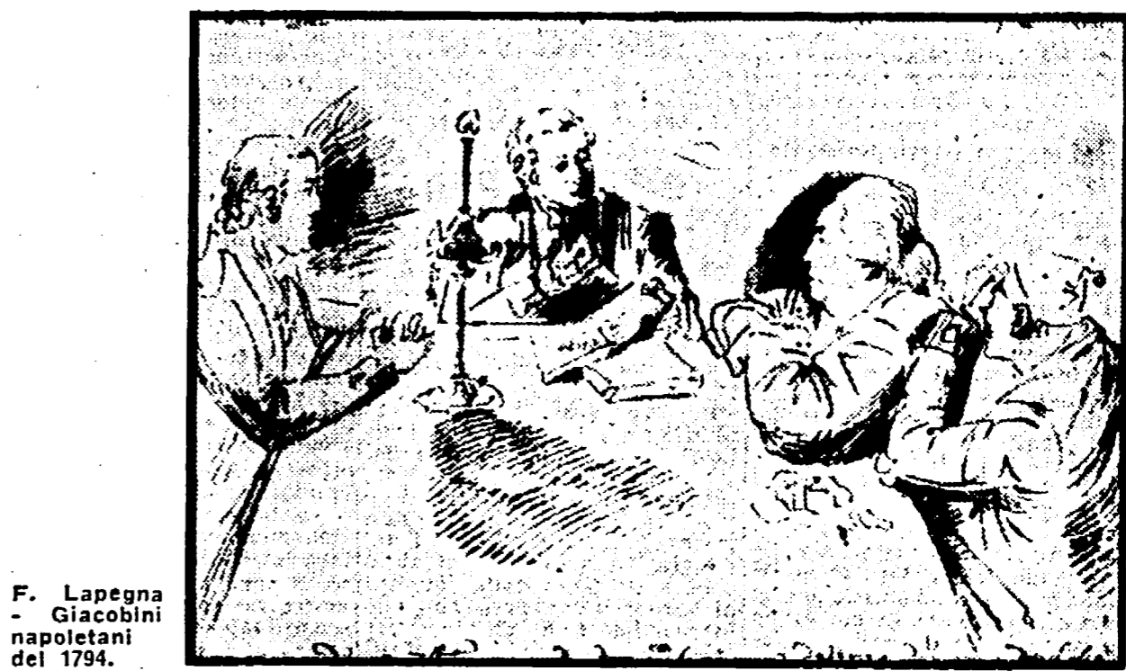
F. Lapegna - Giacobini napoletani del 1799.