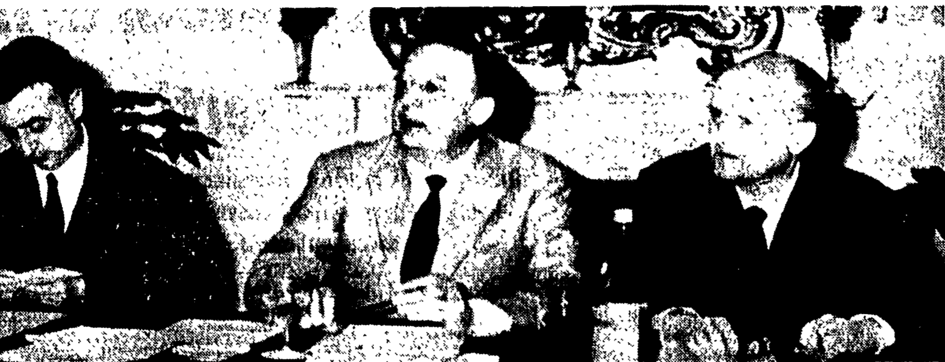
I tre « big » del Consiglio Federale della Federcalcio Franchi, Pasquale e Perlasca. Cosa faranno dopo il minaccioso comunicato dell'altro giorno e dopo la decisione (già presa anche se non rivelata) di non permettere l'interruzione del campionato per favorire la soluzione del « caso Bologna » se domani la Commissione giudicante si rifiuterà di emettere un verdetto definitivo preferendo attendere la possibilità di avere a disposizione i campioni sequestrati dal Procuratore della Repubblica di Bologna per la « controprevidenza » o una sentenza della magistratura prima di pronunciarsi?

Domani la società felsinea, e i giocatori rossoblu incriminati per aver usato sostanze doping nella partita con il Torino torneranno davanti alla Commissione giudicante e poiché la magistratura non ha concesso il rinvio organico per effettuare le « controprove » richieste dal dott. Campana non si può escludere che « l'imbroglione anti-doping » termini con una conclusione sorprendente.