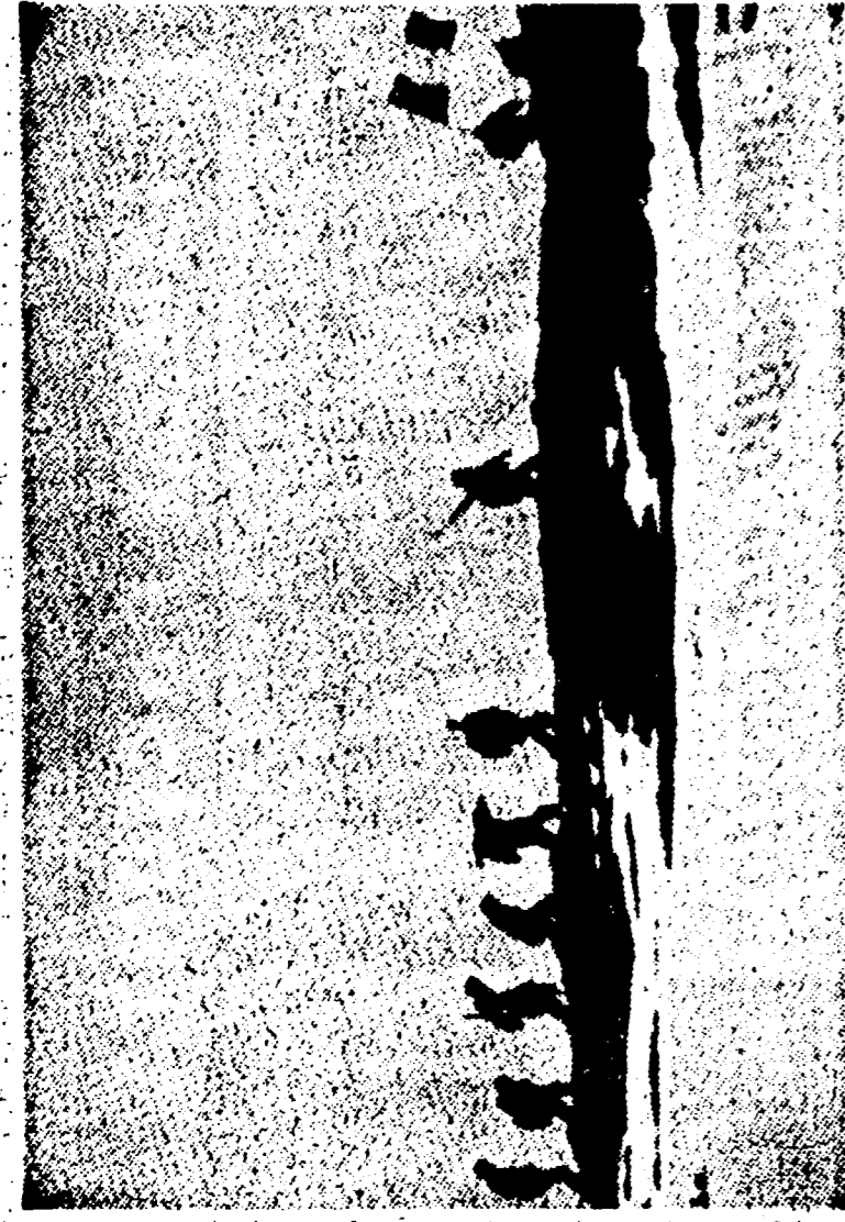
Partigiani sui monti della Val Aosta

La guerra partigiana fu una guerra nuova, una guerra di popolo. Si combatté per la libertà e per l'indipendenza. I partigiani furono eroi e martiri. La loro lotta fu una lotta per la libertà e per la giustizia.