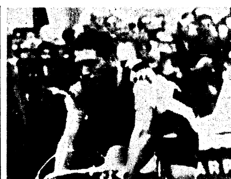
Sulla foto dei 288 chilometri, sulle strette, tortuose strade della Riviera dei Fiori, con il previsto movimento, e con il corteo delle automobili e delle motociclette, il pericolo sarà continuo, dunque, non escludiamo che la corsa-corrida possa trasformarsi in corsa-lottoria, e ci regali il numero matto.

Frances. Foré, Planckaert, Daems, Simpson, Melckenbeeck, De Roo, Elliott e i reduci della Parigi-Nizza, i cui file una recente tradizione vuole ch'essa il vincitore. Un nome? Può darsi che sia fra i proclamati. E, però, non si può scartare il signor X, saputo che parlano in duecento e più. La organizzazione, preoccupata, si chiede: «Una corsa o una corrida?»