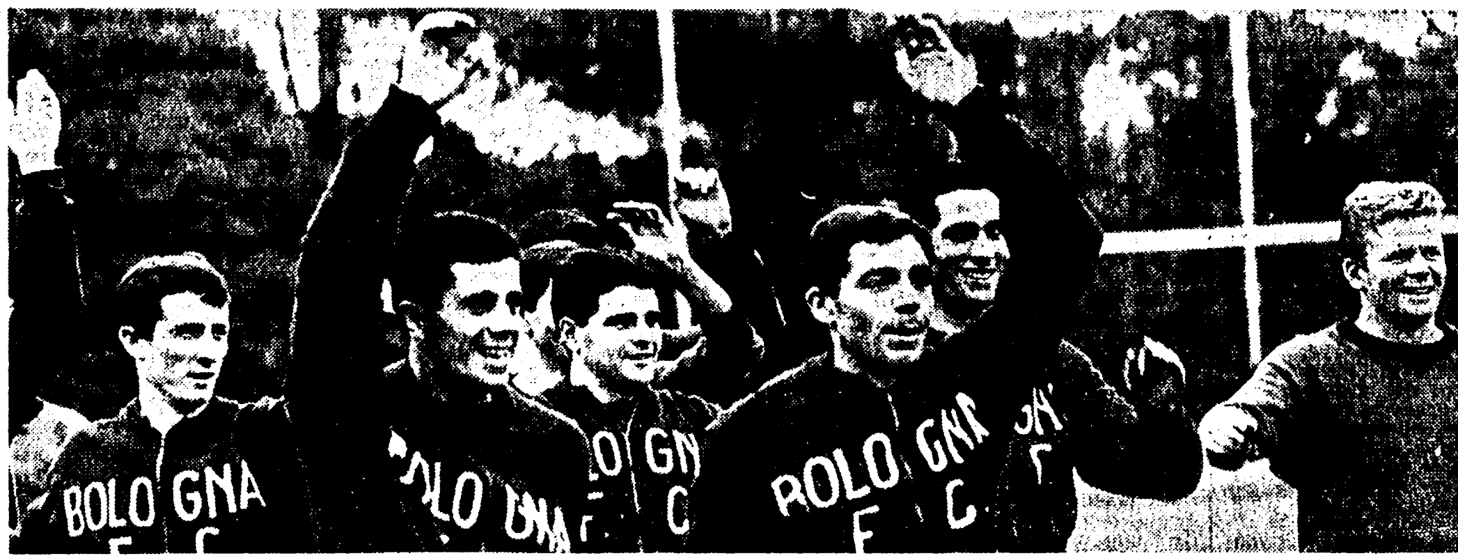
La classifica aggiornata