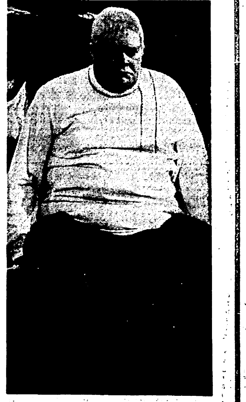
In teatro è l'attore dell'anno per la sua interpretazione di «Vita di Galileo». Ma, nonostante lo impegno quotidiano nel dramma di Brecht, Tino Carraro compare con assiduità sia alla radio, sia alla televisione. Questa settimana sarà il protagonista, alla radio, del «Gioco delle parti», di Pirandello.