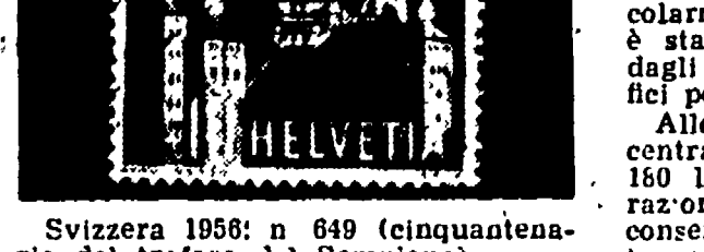
Svizzera 1958: n° 649 (cinquantenario del traforo del Sempione)

Razionato il Michelangelo da 185 lire La serie emessa dalle poste italiane, per la celebrazione di Michelangelo, ha avuto una rapida fortuna, particolarmente il valore da 185 lire, che è stato, per qualche tempo, assente dagli sportelli filatelici di alcuni uffici postali delle città italiane.