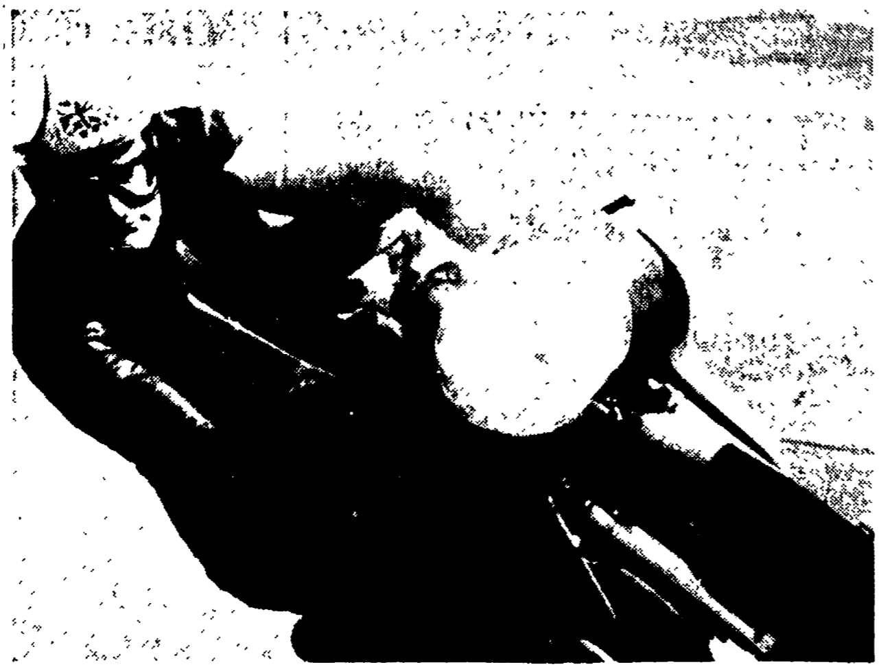
Hallwood, l'Inglese che ha dominato a Cesenatico