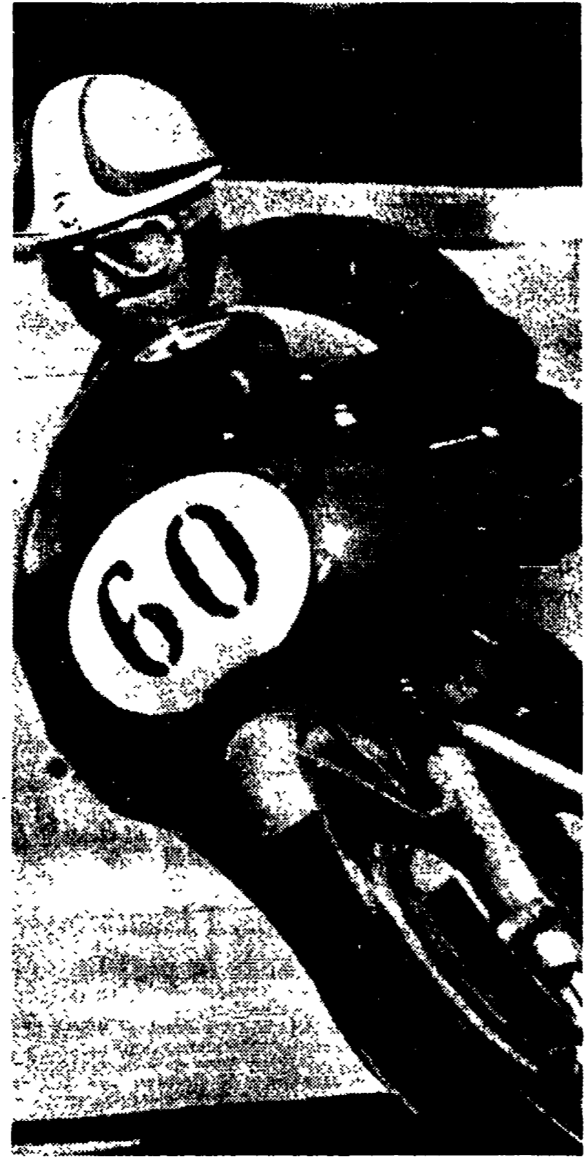
Remo Venturi protagonista del duello con Hallwood