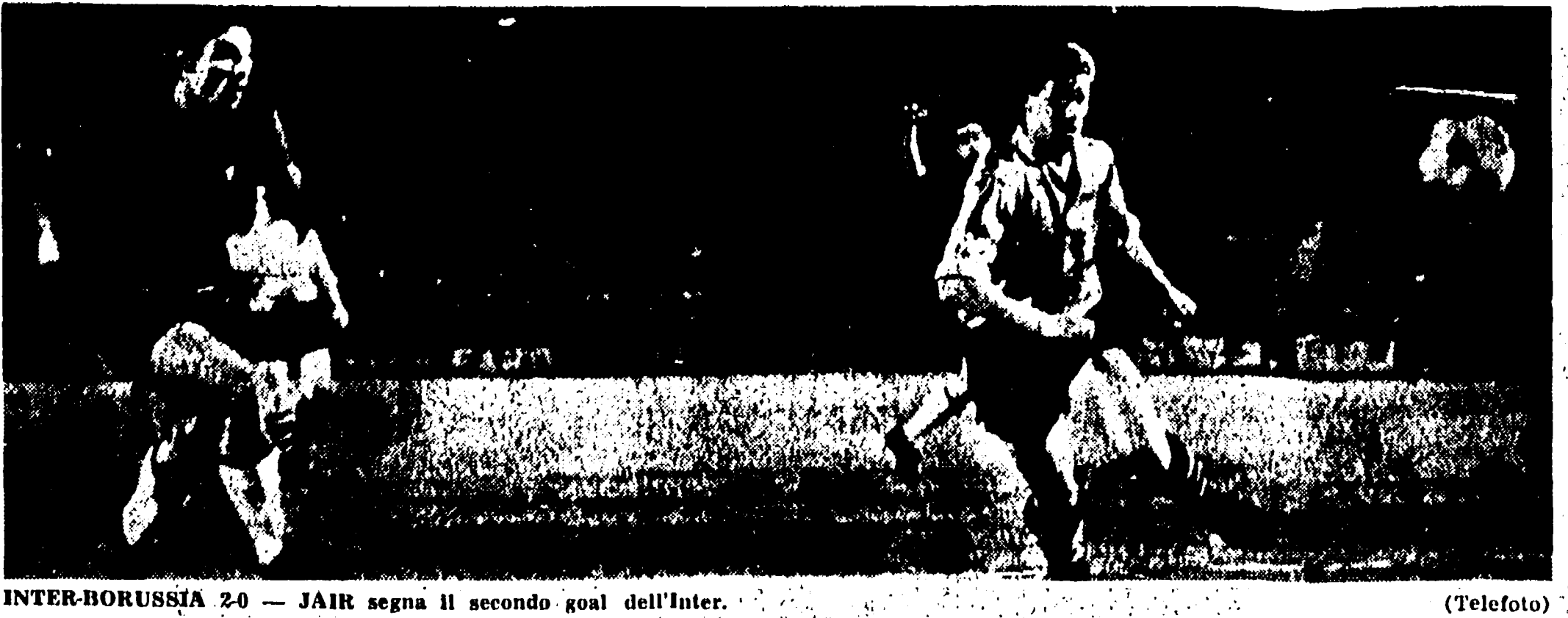
INTER-BORUSSIA 2-0 — JAIR segna il secondo goal dell'Inter.