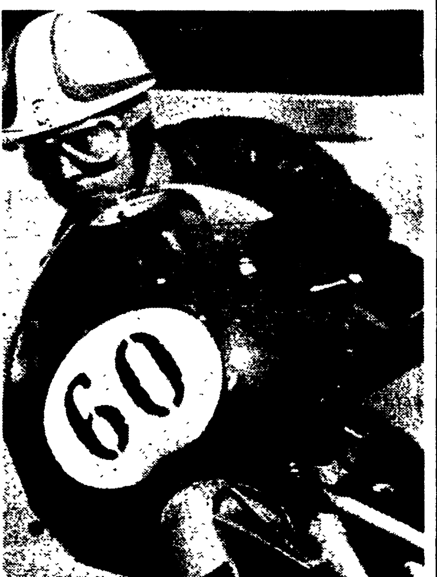
Venturi dopo il primo giro ha avuto serie noie alla moto