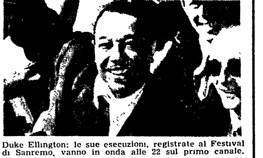
Duke Ellington: le sue esecuzioni, registrate al Festival di Sanremo, vanno in onda alle 22 sul primo canale.