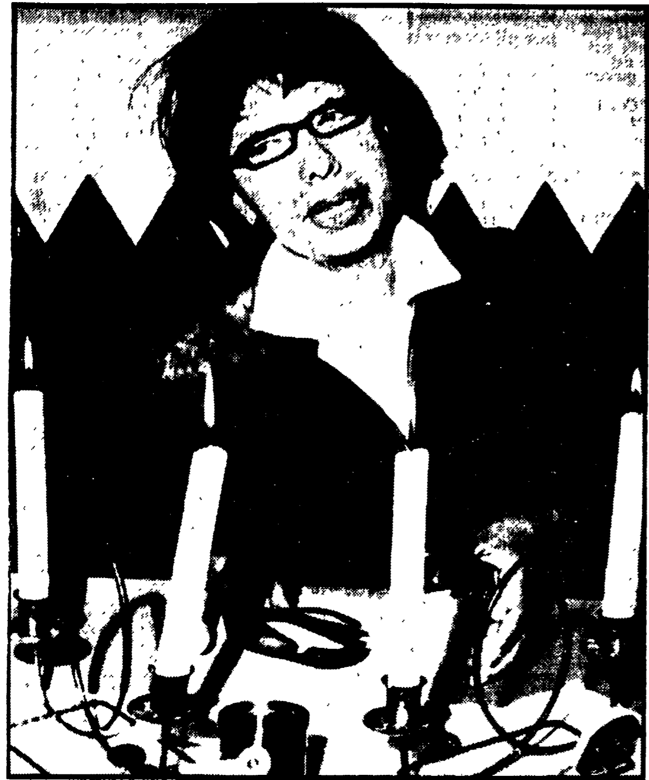
LES MILANDES (Francia) — La cantante Josephine Baker durante la conferenza stampa tenuta l'altro ieri sulle sue precarie condizioni finanziarie...