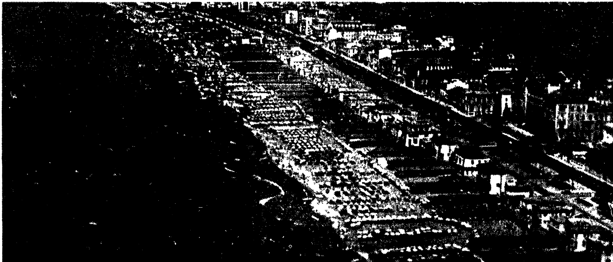
VIAREGGIO - Un'immagine della spiaggia.