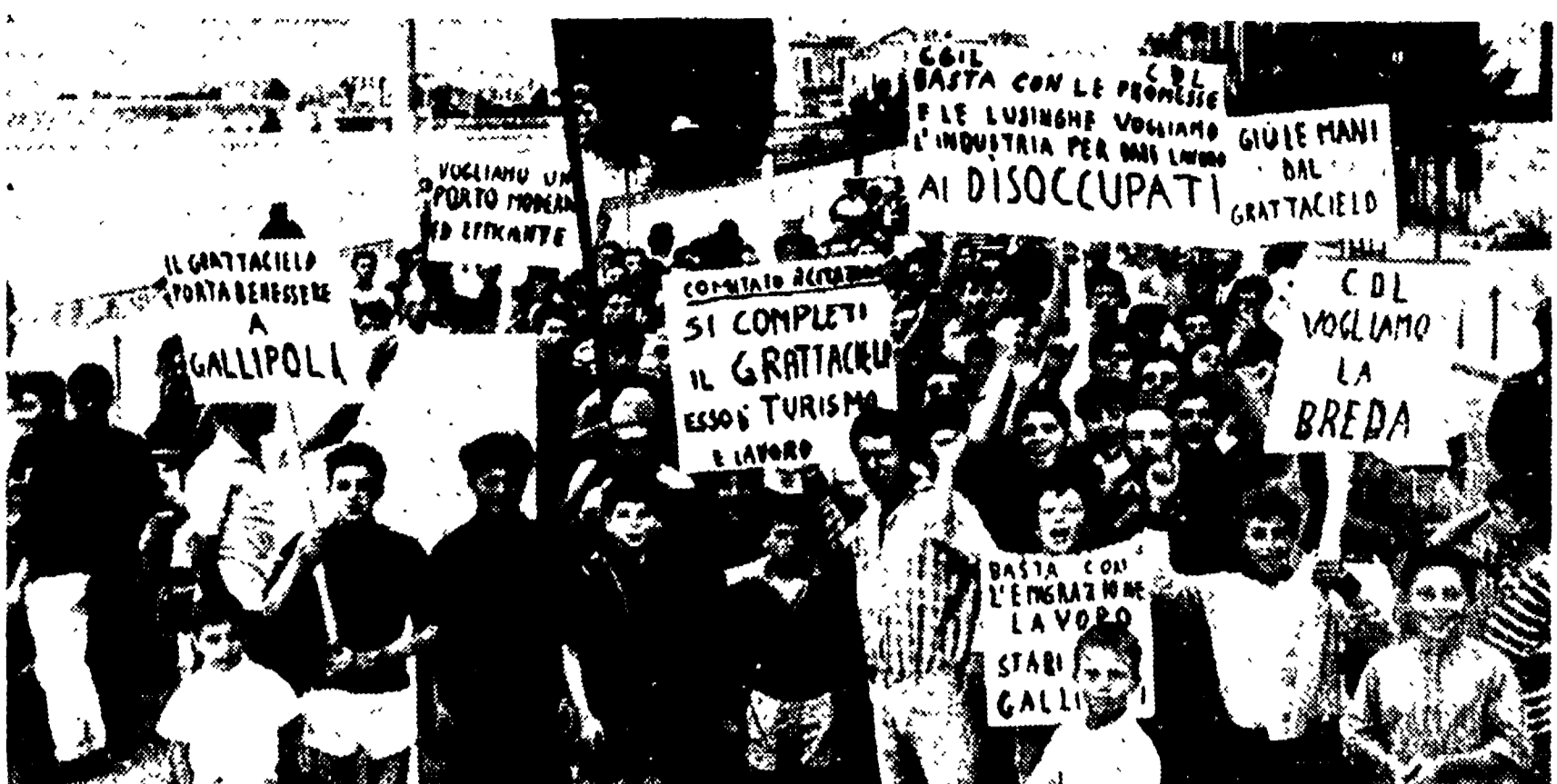
GALLIPOLI — La manifestazione di protesta degli edili. Sulla destra si notano le strutture portanti del grattacielo