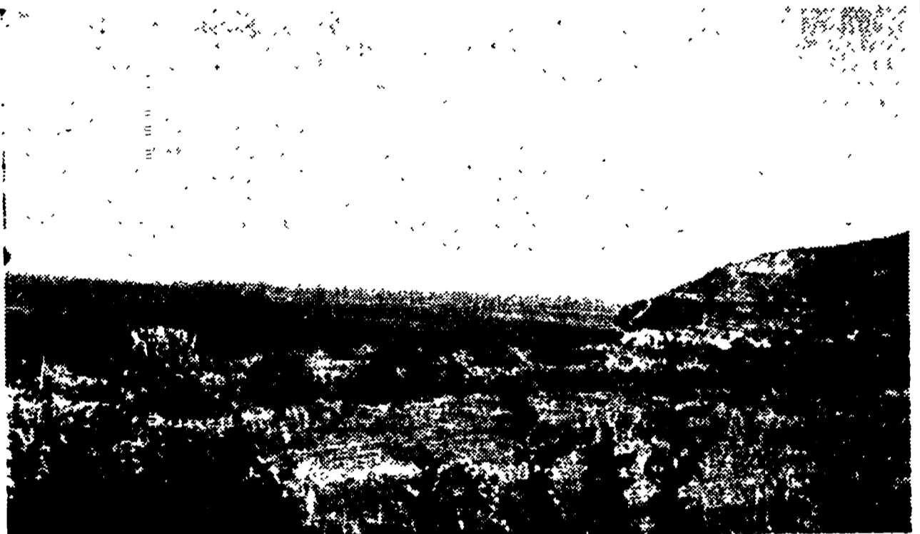
VILLA S. GIOVANNI — L'incantevole località espropriata a fini speculativi

La Società «Birra Aspromonte» ha ottenuto oltre 62 mila mq. di terreno in una zona destinata ad un eccezionale sviluppo turistico - La condiscendenza del Comune di Villa S. Giovanni