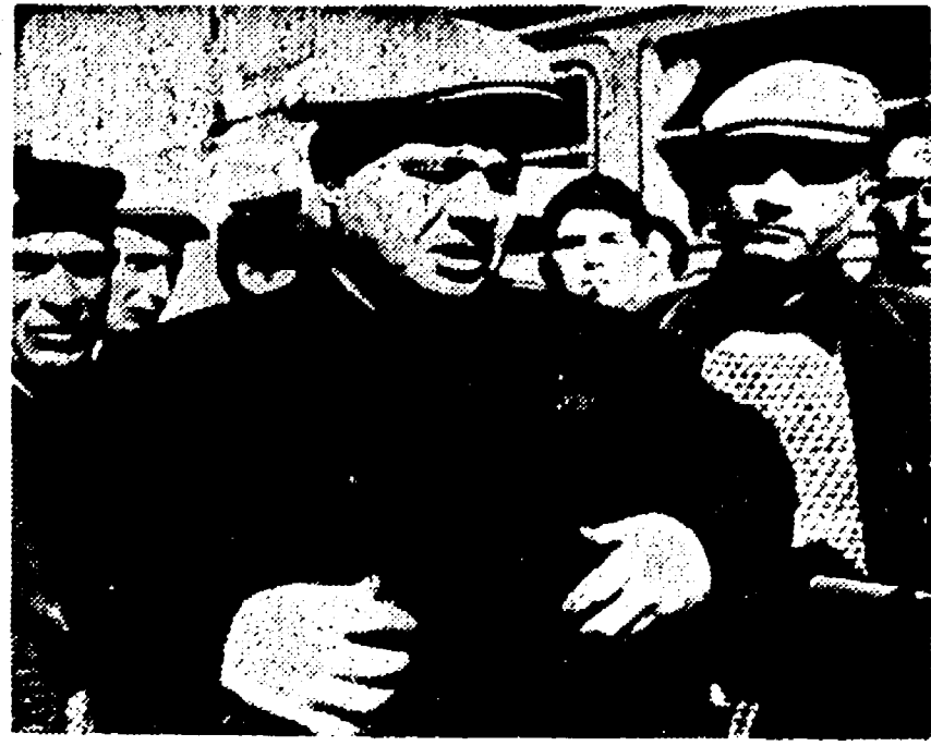
Lo zio del giovane pastore ucciso.