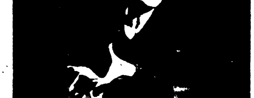
Zizi Jeanmaire in «Parade», storia del balletto (primo, ore 22,15)

17: Una scarpa. Racconto; 17,20: Antonio Vivaldi, Alessandro Stradella; 18,30: La Rassegna. Cinema; 18,45: André Jolivet; 19: La via dei castelli piemontesi e valdostani; 18,30: Concerto di ogni sera. Johann Sebastian Bach, Igor Stravinsky; 20,30: Ritratto di un'artista; 20,40: Benjamin Britten, Darius Milhaud; 21: Il Giornale del Terzo; 21,20: Ritmo-fantasia; 21,35: Uno show che si chiama Napoli; 10,35: Giugno Radio-TV 1964; 10,40: Le nuove canzoni italiane; 11: Intervista all'autore. Un atto di Jean Anouilh.