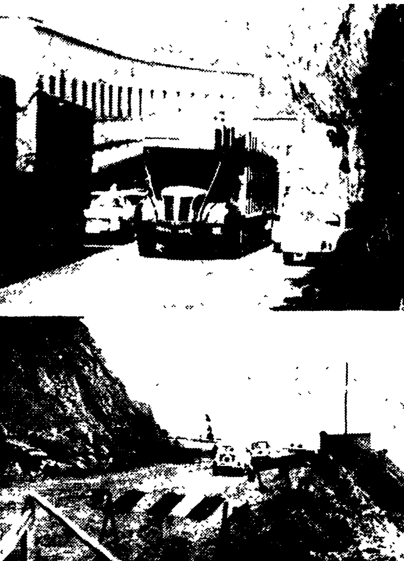
La strozzatura del valico di confine a Ventimiglia (foto in alto) e (in basso) uno degli eterni «lavori in corso» dell'Aurelia ligure.

«Il problema è in luglio e agosto: certe giornate da Mentone a Ventimiglia è una ininterrotta fila di macchine. Dodici chilometri di ingorgo».