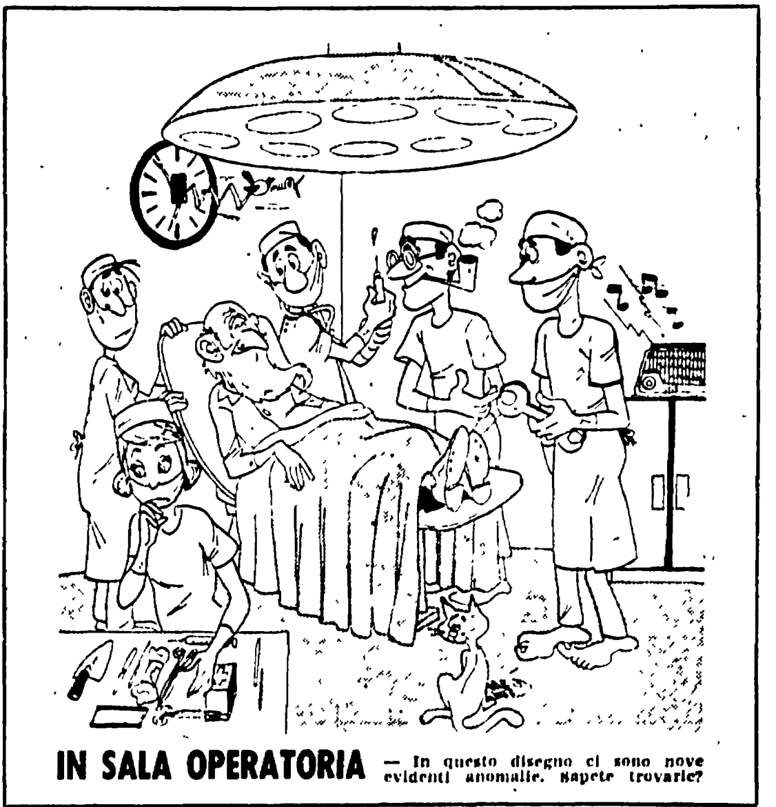
IN SALA OPERATORIA - In questo disegno ci sono nove evidenti anomalie, sapete trovarle?

1. Sigaracci; 2. Inciduto; 3. Garibaldi; 4. Acidatori; 5. Ribaltare; 6. Adattarsi.