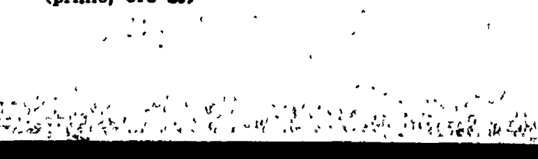
Jennifer Jones nel film «Gli amanti del sogno» (primo, ore 21)

Un film, un atto unico, i «big» dell'atletica Sul primo canale va in onda stasera «Gli amanti del sogno», film con Jennifer Jones e Joseph Cotten, dalle tinte drammatiche e sentimentali e con una punta di commedia. Invece, un atto unico di Lorenzo Ruggeri, la storia di un magistrato che scambia per la propria camera d'albergo, prima quella di una ragazza e poi quella di un prelati. Ma il «clou» della serata è senza dubbio la cronaca registrata dello «scontro» tra gli atleti dell'atletica leggera americana e sovietica. Una specie di prova generale per le Olimpiadi. Un'occasione per vedere quelle autentiche «stelle» che risplendono ai nomi di Brunel, Connolly, Hayes.