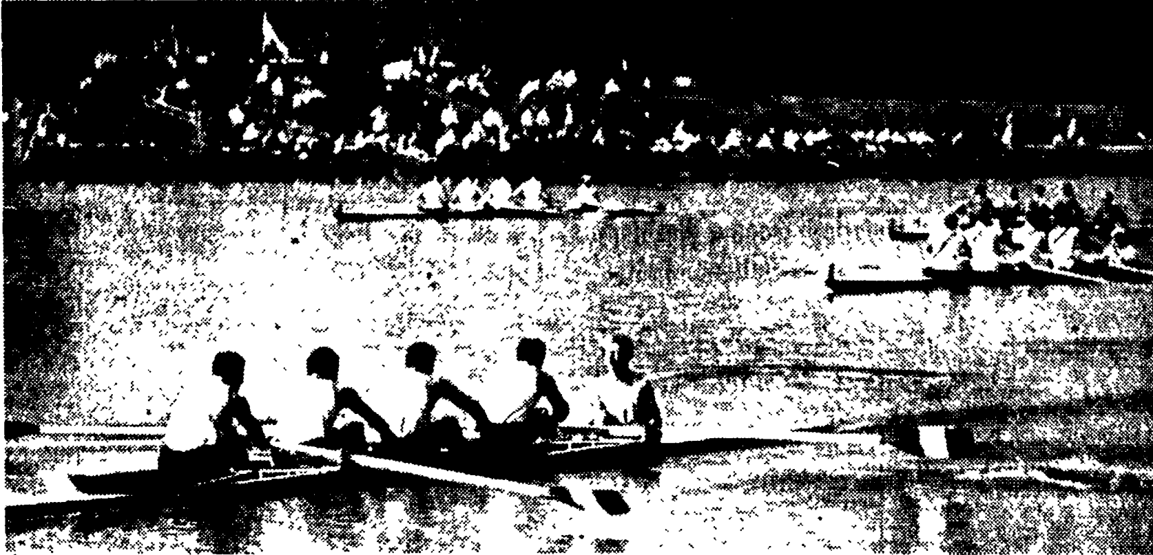
AMSTERDAM - Il «quattro con» azzurro (in primo piano) taglia vittorioso il traguardo

NUOVI APPARECCHI di misurazione, che danno automaticamente il tempo e la posizione dei nuotatori durante la gara, sono stati sperimentati dalla Federazione giapponese. Questo nuovo apparecchio comprende varie appendici: placche incorporate, contatori elettronici, un registratore di prova e uno di record, un registratore, un orologio elettronico e un microfono per lo starter. Il