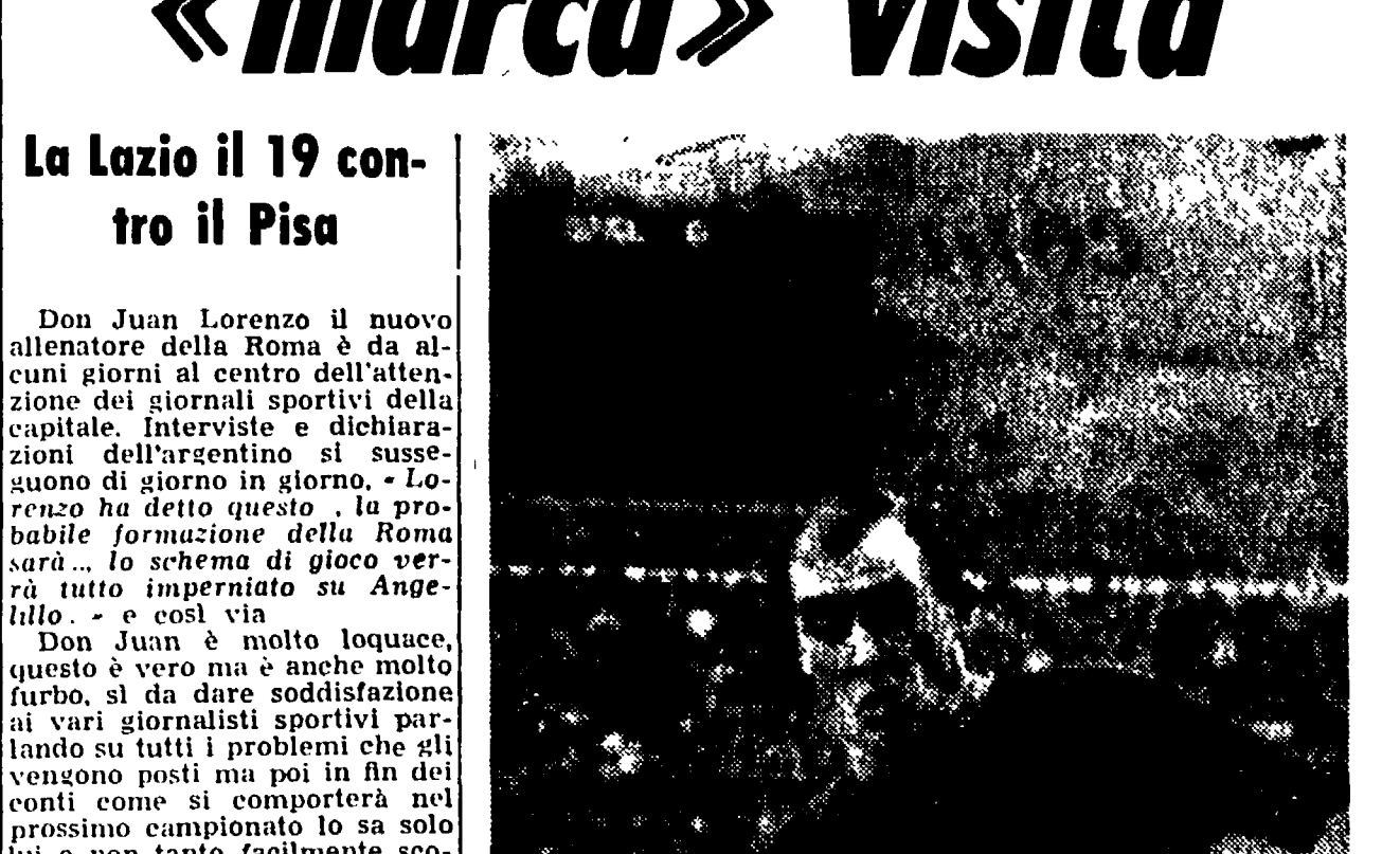
La Lazio il 19 contro il Pisa

PRIMOATTOZZI partecipanti ai Giochi Olimpici. Le selezioni hanno già superato di un unità il record di nazionali (84), partecipanti raggiunti a Roma: gli organizzatori sperano di superare il limite delle 100 nazionalità.