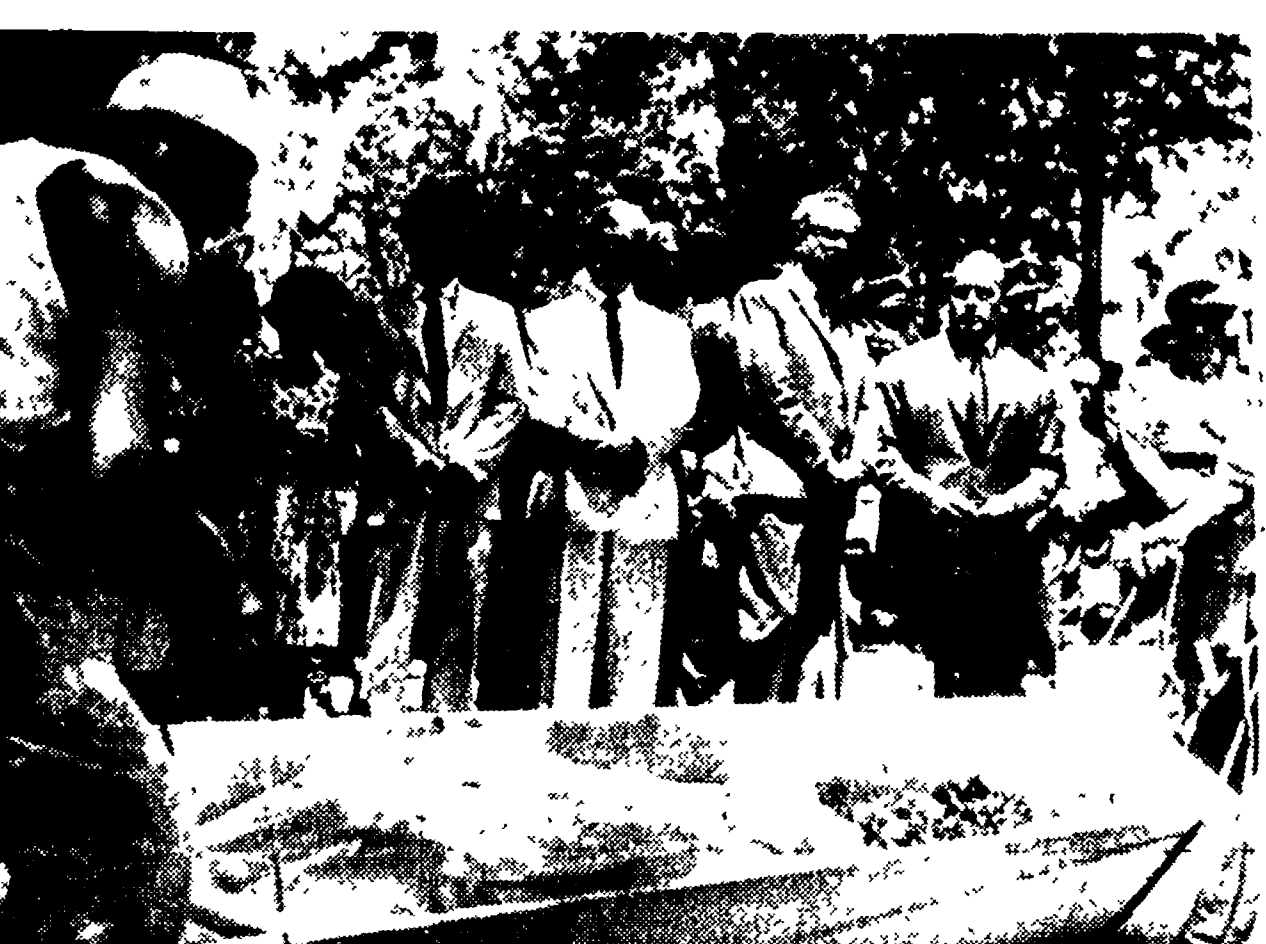
Il generale Grivas (in piedi, al centro) tra un gruppo di persone, assiste al seppellimento di una delle vittime del bombardamento turco delle navi di Xeros.