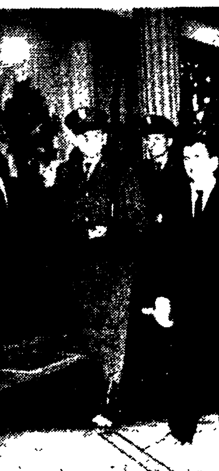
VARSAVIA - Si sono svolti ieri i solenni funerali del presidente del Consiglio di Stato della Repubblica polacca, compagno Alexander Zawadzki...