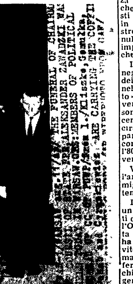
VARSAVIA - Si sono svolti ieri i solenni funerali del presidente del Consiglio di Stato della Repubblica polacca, compagno Alexander Zawadzki...