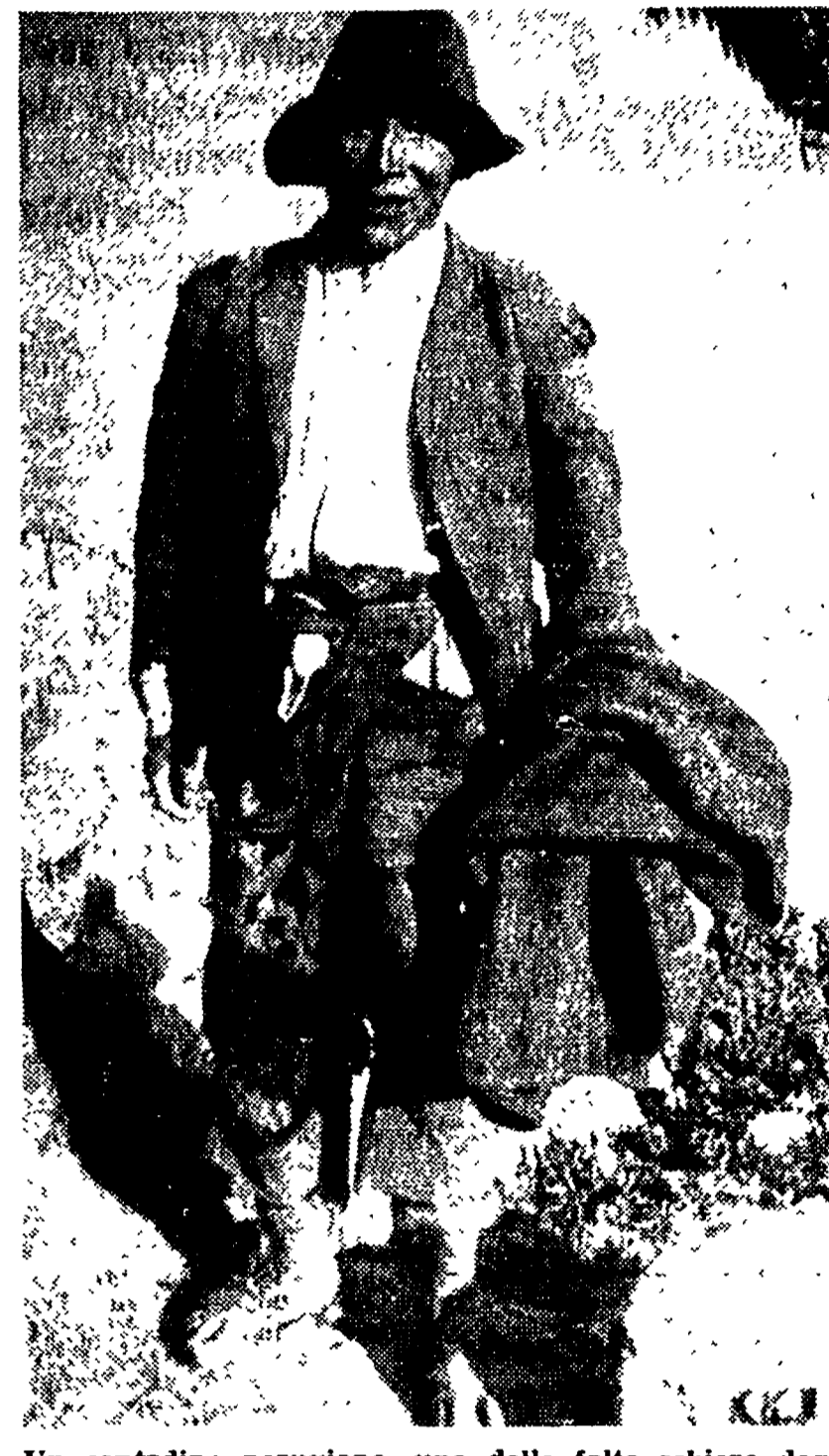
Un contadino peruviano, uno delle folte schiere degli indios che abbandonano la Sierra inurbandosi a Lima

sterminata. Vi abitano le tri-... (text continues)