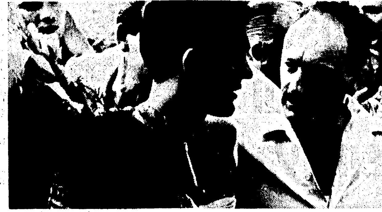
VITTORIO BARTALI il vincitore della corsa di Carrara.