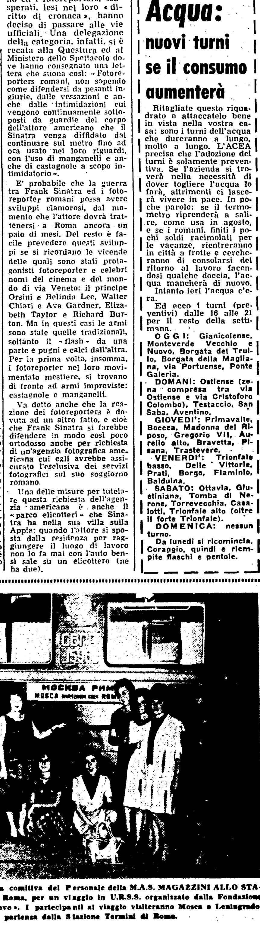
Domenica scorsa è partita la comitiva del Personale della M.A.S. MAGAZZINI ALLO STATUTO - Via dello Stato - Roma, per un viaggio in U.R.S.S. organizzato dalla Fondazione Enrico e Rosetta Castellino. Partecipano al viaggio viiteranno Mosca e Leningrado. La foto ritrae la comitiva in partenza dalla Stazione Termini di Roma.

il partito Convocazioni TIVOLI, Segreteria Zona, ore 19; CIVITAVECCHIA, Fredduzzi, ore 18,30; ARDEA, ore 19, C.D. con Banca; L'ANCIUTO, ore 19, Assemblea con Marini; OSTIA, giovedì 19, Comitato Direttivo della zona. Provincia Domani, alle ore 17,30 in Federazione è convocata la Commissione Provinciale.