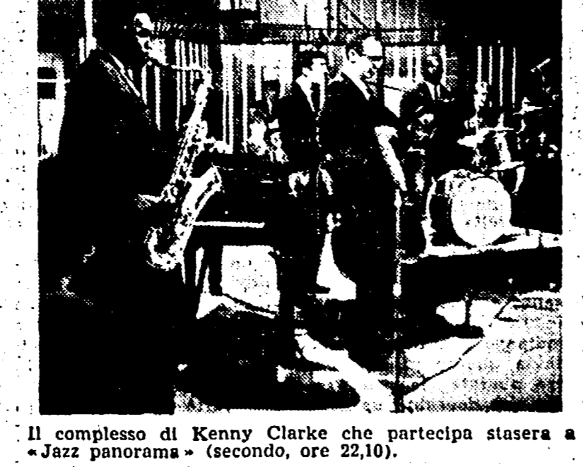
Il complesso di Kenny Clarke che partecipa stasera a «Jazz panorama» (secondo, ore 22,10).