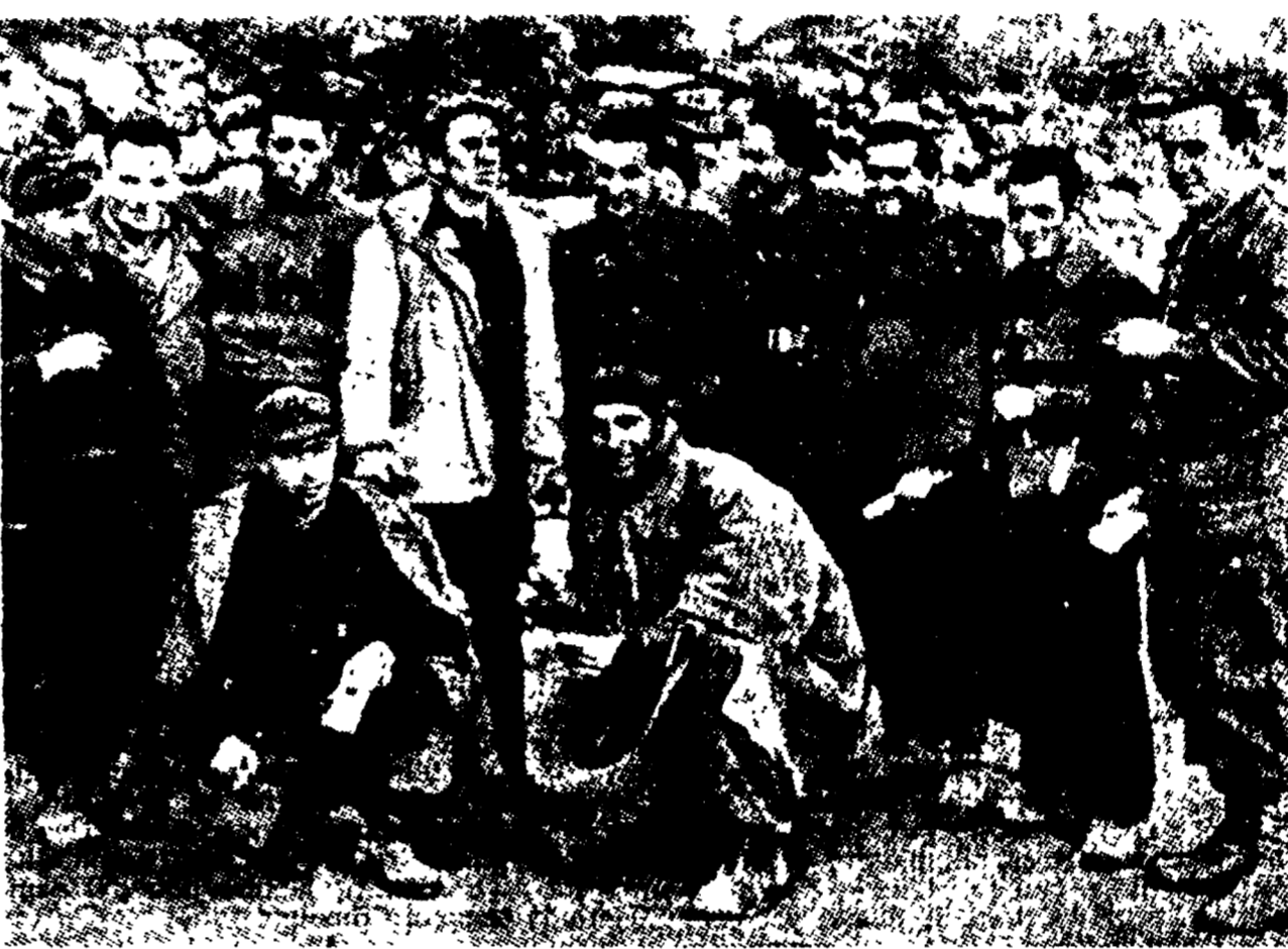
Il compagno Longo fu il primo comunista italiano accorso a Madrid per organizzare la difesa della seduzione franchista e dall'aggressione di Hitler e di Mussolini. Nella foto: Longo (Gallo), ispettore delle Brigate Internazionali con i commissari politici della battaglia Garibaldi.