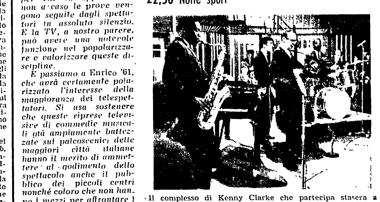
Il complesso di Kenny Clarke che partecipa stasera a «Jazz panorama» (secondo, ore 22,10).