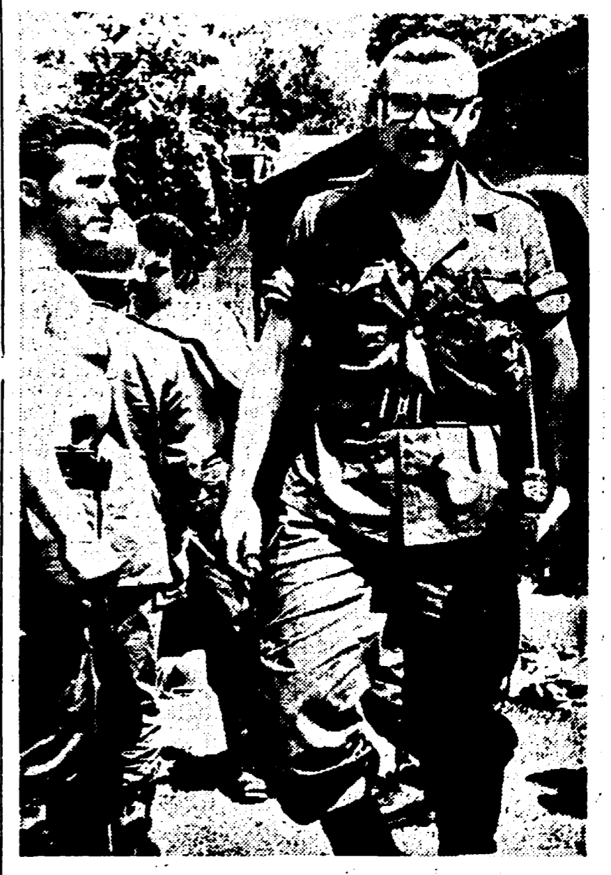
ALBERTVILLE — Tre mercenari italiani assoldati da Ciombe. (Telefoto)

Scandalose proporzioni dell'ingaggio di bianchi per la « Legion straniera » ciombista