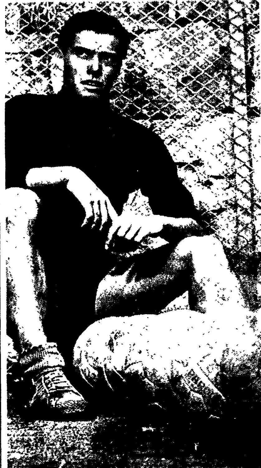
NICOLÈ sarà il n. 9 giallorosso contro il Torino?

Nella Lazio a Pescara rientra Petris al posto di Bartù